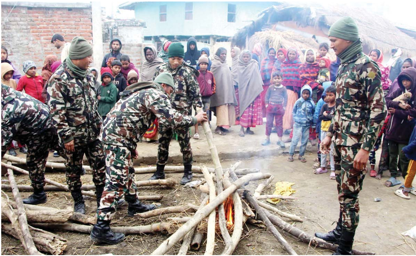
मुसहरबस्तीमा सल्लाहीको हरिपुर नगरपालिका-६ लक्ष्मीपुरको मुसहरबस्तीका विपन्न परिवारलाई चिसोवाट बच्न दाउरा वितरण तथा आगो बाढ्दै नेपाली सेनाको टोली ।