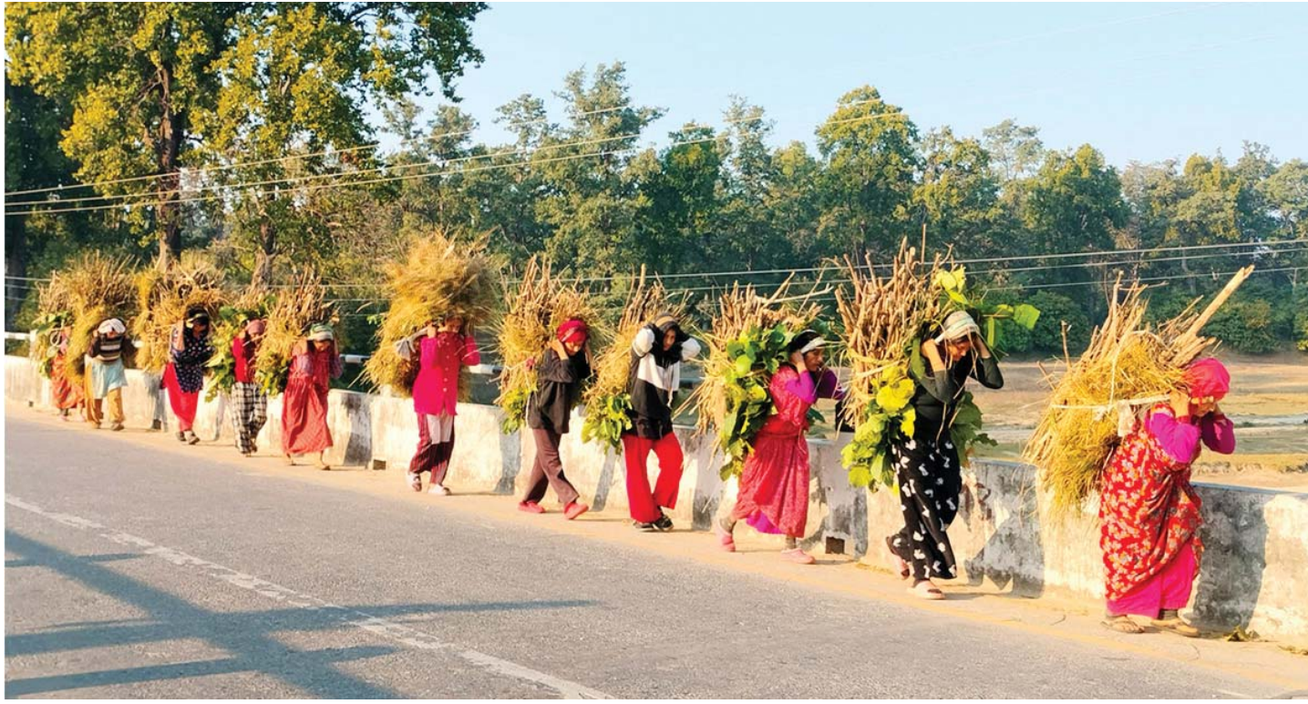
घाँसदाउराको जोहो | कञ्चनपुरको शुक्लाफाँटा राष्ट्रिय निकुञ्जस्थित अर्जुनी सेक्टर क्षेत्रबाट घाँसदाउरा बोकेर ल्याउँदै गरेका महिला। खरखडाइका लागि निकुञ्ज तीन दिन खुला गरिएपछि घाँसदाउरा गर्न स्थानीयको घुइँचो लागेको छ।