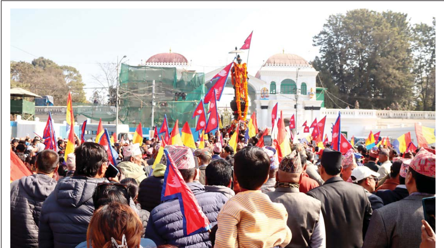
पृथ्वी जयन्ती | ३०औं पृथ्वी जयन्तीका अवसरमा शनिवार सिंहदरवारको पश्चिम द्वारस्थित पृथ्वीनारायण शाहको शालिकमा माल्यार्पण तथा पुष्पगुच्छा अर्पण गर्ने क्रममा सहभागीहरू।