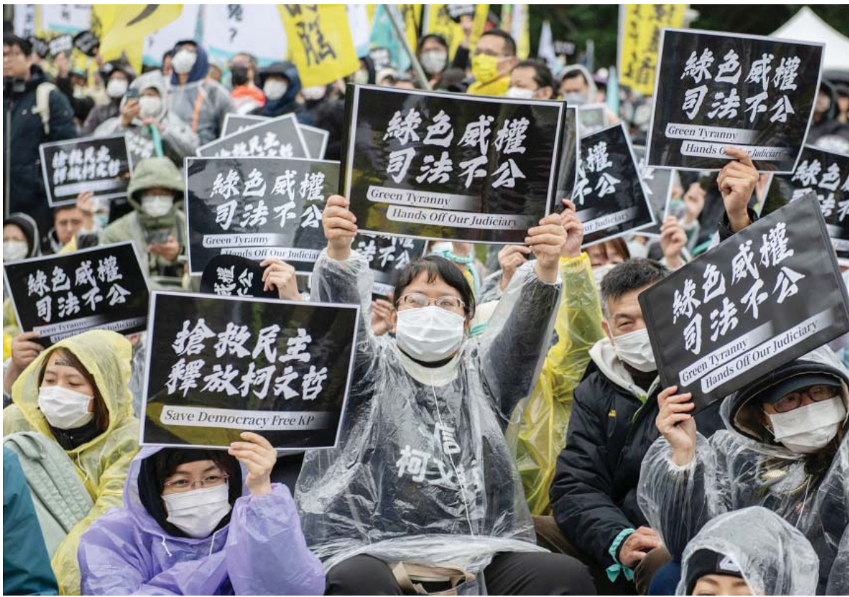
ताइपेईमा पूर्वविपक्षी नेता तथा पूर्वमेयर को वेन-जेविरुद्धको न्यायिक अन्यायको विरोधमा ताइवान पिपुल्स पार्टीद्वारा शनिबार आयोजित प्रदर्शनमा सहभागीहरू नारा लगाउँदै ।