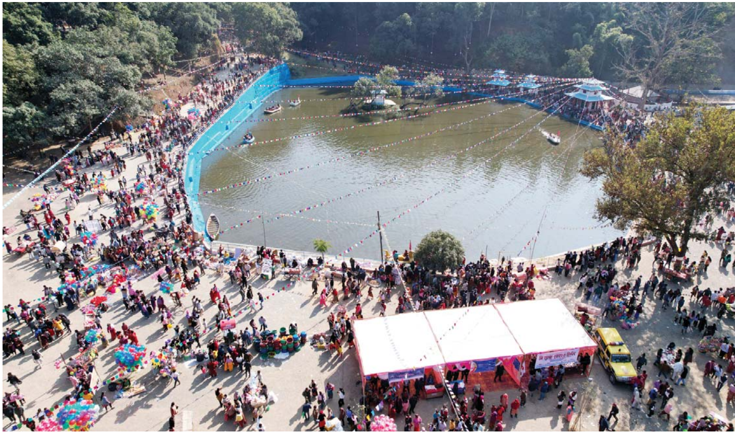
बाह्रकुने दह मेला | बाडको घोराही उपमहानगरपालिका-१३ स्थित प्रसिद्ध धार्मिकस्थल बाह्रकुने दहमा माघसक्रान्तिका अवसरमा मंगलबार लागेको मेलाका सर्वाधाराणाको घुईचो। माघी पर्वमा हरेक वर्ष यहाँ ठूलो मेला लाग्ने गर्छ।