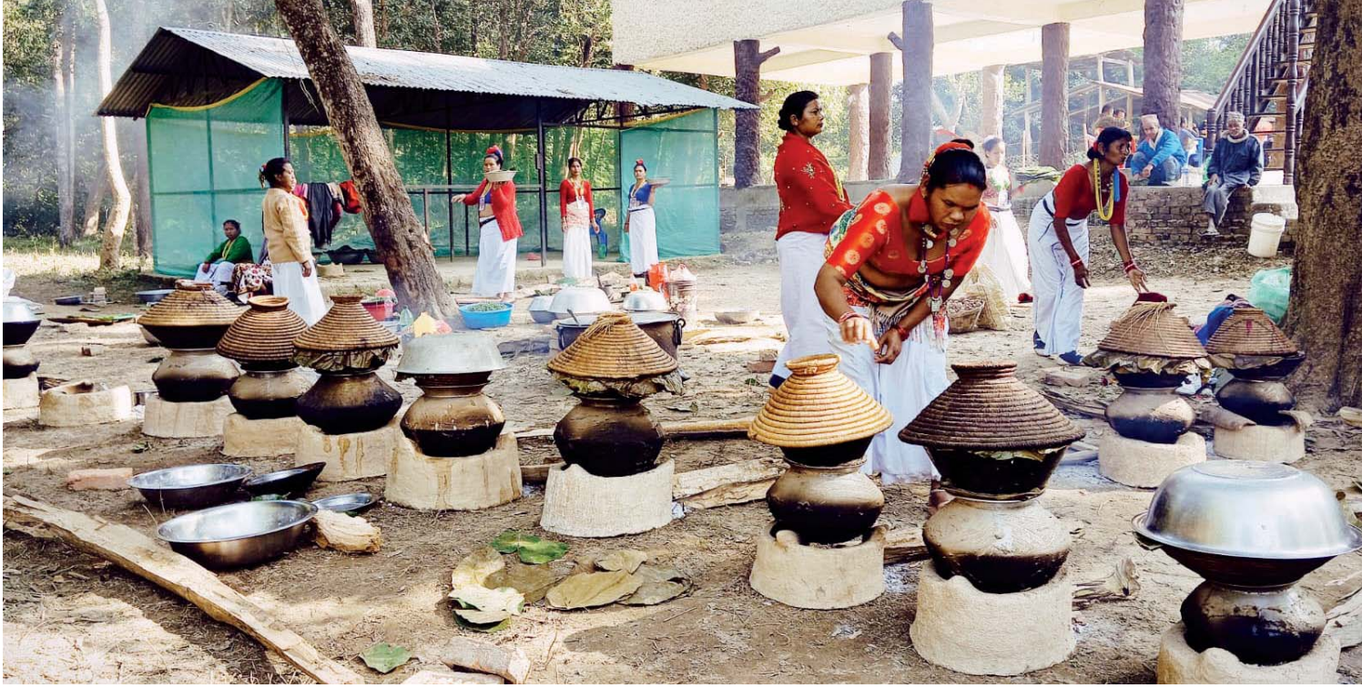
यारु समुदायको पूर्व माघी एवं नयाँ वर्षका अवसरमा बाँकेको बैजनाथ गाउँपालिका-१ च्यामामा ढिक्रीसँगै घाँगी, डोकिनको चटनी, सिद्रा माछाको तरकारीलगायत परिकार पकाउँदै थारु महिला ।

वर्ष ११ अंक २६० काठमाडौं बुधबार, ०२ माघ २०८१ Prabhav National Daily Wednesday, January 15, 2025 www.prabhavonline.com पृष्ठ ८ मूल्य रु. ५१-