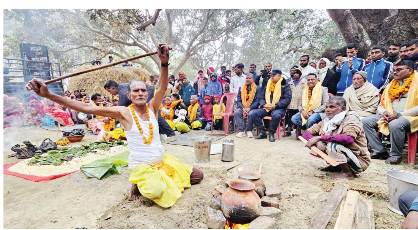
सखते परम्परा | महोत्सरीको मटिहानीमा मंगलबार माघे संक्रान्ति (तिला सकराइत) का अवसरमा खतवे जातिको कुलदेवी सोसिया निकुंभियाको परम्परागत पूजामा तातो दूधले स्नान गरेर देवीलाई प्रशन्न गराउन दूध तताउँदै धामी परीक्षण खतवे।