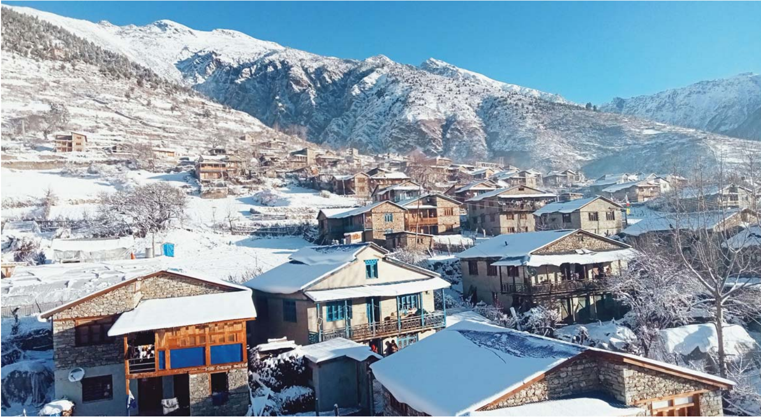
हिमापातपछिको सिमकोट | हुम्लाको सदरमुकाम सिमकोट र आसपासका डाँडाकाँडा हिमापात रोकिएपछि शुकुबार विहान देखिएको दृश्य ।