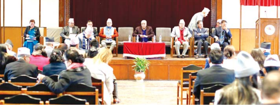
सोमबार सिंहदरबारमा बसेको कांग्रेस संसदीय दलको बैठक