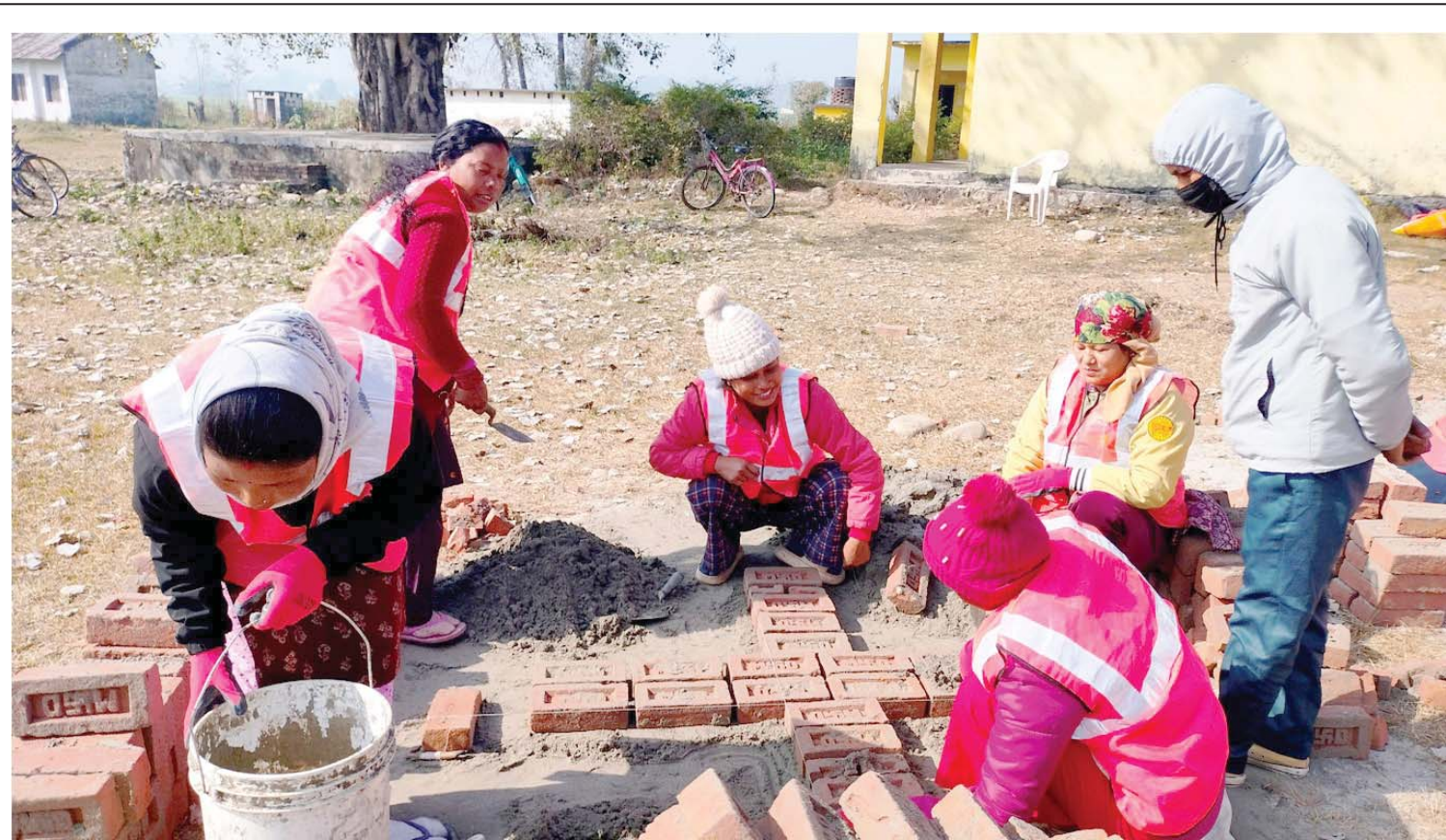
डकमी तालिम | डकमीसम्बन्धी तालिम लिदै कञ्चनपुरको शुक्लाफाँटा नगरपालिकाका महिला। उक्त नगरपालिकाको सहयोगमा १२ वटै वडाका २० जना महिलालाई तीन महिने डकमी तालिम दिने कार्य भइरहेको छ।