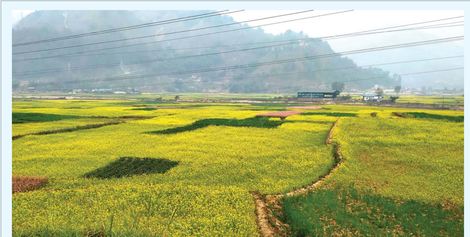
तोरी स्याङ्जाको वालिङ १ मजुवा, कालीमाटी फाँटमापहेँलपुर देखिएको तोरीखेती। उत्पादन राम्रो हुने भएकाले किसानहरू तोरी खेतीतर्फ आकर्षित भएका छन्।