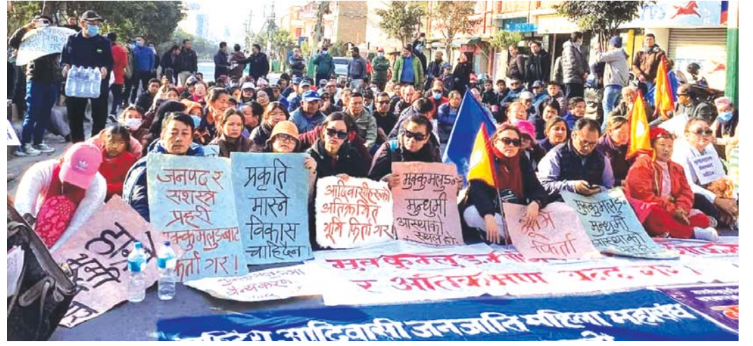
ताप्लेजुङको मुक्कुम्लुडमा स्थानीयमाथि प्रहरीले गोली चलाएको विरोधमा सोमबार काठमाडौंमा भएको विरोध प्रदर्शन ।