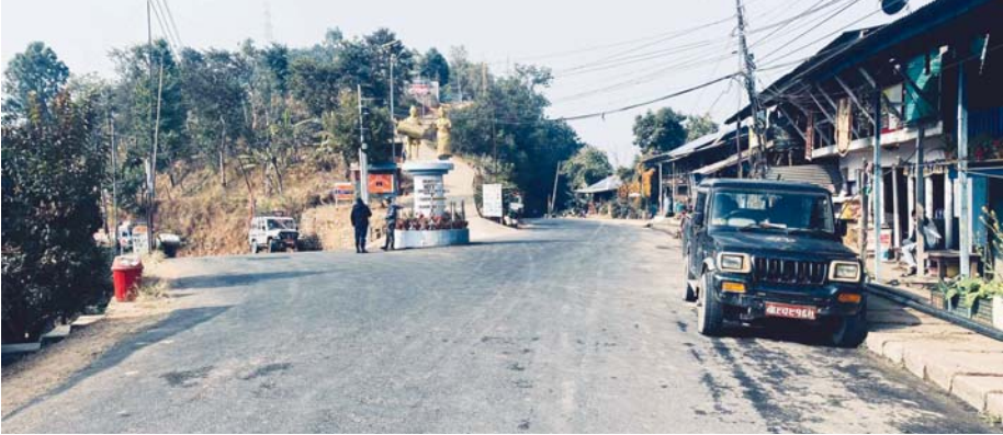
केबलकार खारेजीको मागसहित आन्दोलनरत पकले आह्वान गरेको अनिश्चितकाली यातायात बन्दका कारण सुनसान सडक ।