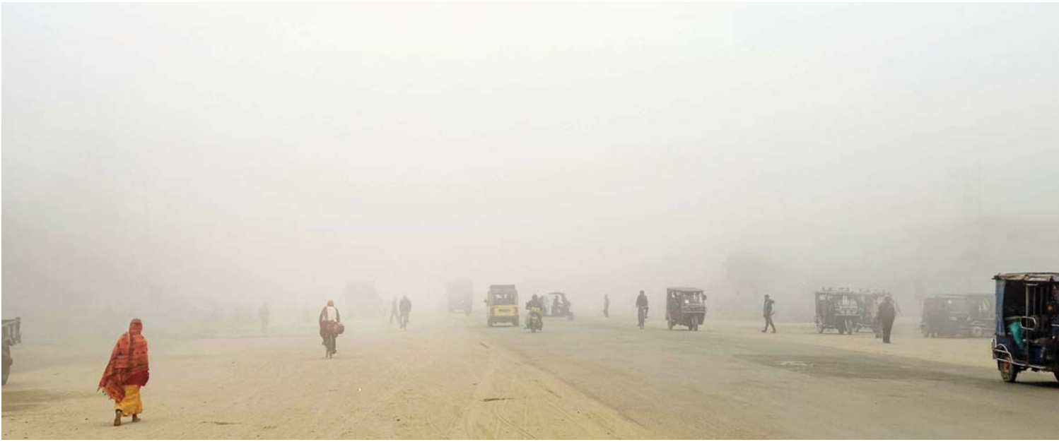
लहानमा कुहिरा | सिरहाको लहानमा मंगलवार बिहान लागेको कुहिरा। बाक्लो हस्सु र कुहिराले यहाँको जनजीवन प्रभावित भएको छ।