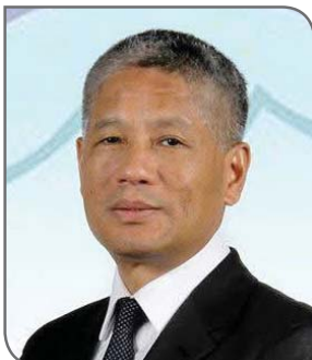
■ शेष घले

आफूले कमाएको पैसालाई जहिल्यै पनि बैंकिङ माध्यमबाटै पठाउनुपर्दछ। विभिन्न मुलुकहरूमा अवैधरूपमा सञ्चालित हुण्डी जस्ता जोखिमपूर्ण माध्यम (सञ्जाल)मा कहिल्यै विश्वास र प्रयोग गर्नुहुँदैन। मुद्राको अवैध कारोबार (हुण्डी) गर्ने दलाल तस्करहरू कतिले नेपाली कामदारहरूको पैसा ठगी गरेर भागेका पनि छन्। त्यस्तो अवैध कारोबार अपनाउँदा देशको राजस्वमासमेत क्षति पुगिरहेको हुन्छ। बैंकिङ माध्यमबाट पठाएको रकमको मात्र स्रोत खुल्ने हुँदा पछि नेपालमा आएर समस्या भोग्नु पर्दैन। अवैध च्यानलबाट पैसा भित्र्याएको खण्डमा आफूले विदेशमा कमाएर जोडेको घर सम्पत्तिको स्रोत खुलाउन नसकेर समस्यामा पर्ने जोखिम हुनसक्छ। त्यसैले सबै बैंकिङ च्यानलकै प्रयोग गर्नुपर्छ।