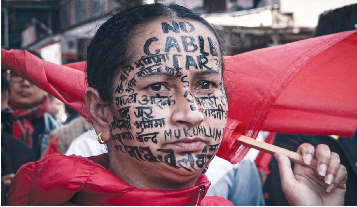
ताप्लेजुङको मुक्कुम्लुङ (पाथीभरा)मा निर्माणाधीन केबलकार खारेजीको मागसहित बुधवार राजधानीमा निकालिएको विरोध न्यालीमा सहभागी एक महिला । उनको अनुहारभरि 'नो केबलकार' लगायतका नारा लेखिएको थियो ।

वर्ष ११ अंक ३१० काठमाडौं बिहीबार, २२ फागुन २०८१ Prabhav National Daily Thursday, March 06, 2025 www.prabhavonline.com पृष्ठ ८ मूल्य रु. ५१-