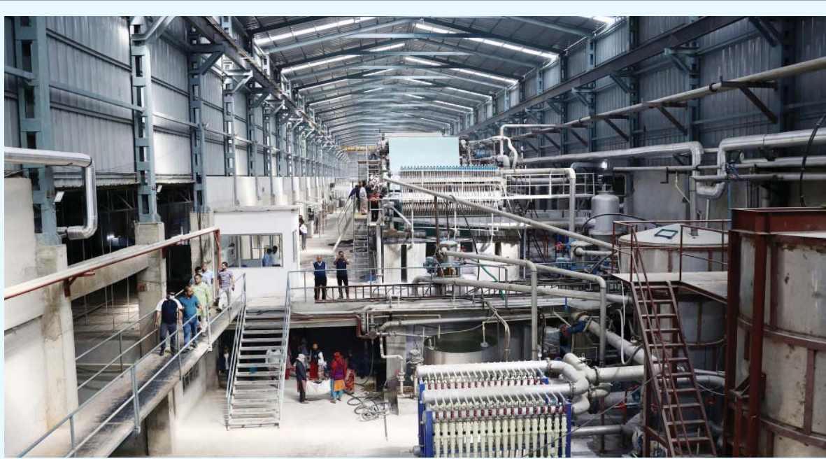
पल्लु एड्स पेपर इन्टरस्टिज महोत्सवी जिल्लाको गौशला नगरपालिका-१, रामनगर इटाटारमा नवनिर्मित नेपाल पल्लु एड्स पेपर इन्टरस्टिज प्रालिमा काजग मिलाउँदै स्थानीय महिला श्रमिकहरू। दुई अर्बभन्दा बढी लगानी रहेको यस उद्योगले ३०० जनाभन्दा बढीलाई रोजगारी दिएको छ।