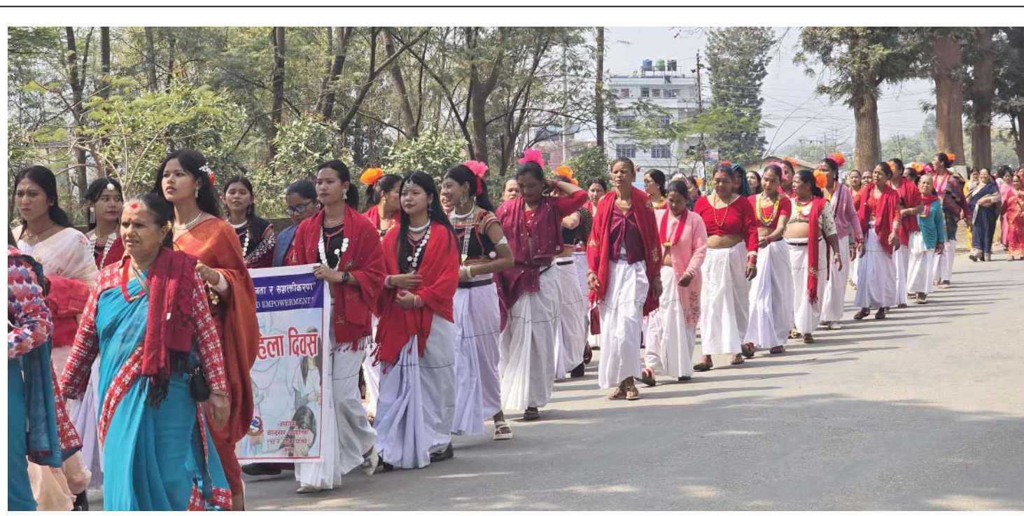
महिला दिवसमा सुर्खेतको वीरेन्द्रनगरमा शनिबार ११५औं अन्तर्राष्ट्रिय महिला दिवसका अवसरमा वीरेन्द्रनगर नगरपालिका-१० कार्यालयले निकालेको पदयात्रामा सहभागी थारु पदायत्री पोसाकमा सजिएका थारु महिला ।