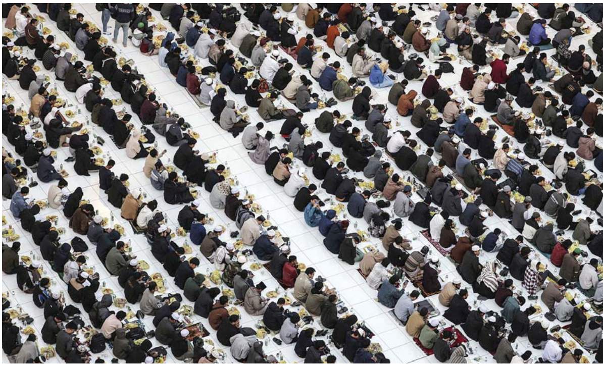
इजिप्टको कायरोमा रमजानको पवित्र महिनामा मुस्लिमहरू आफ्नो इफ्तार, उपवास तोड्ने खानाका लागि पर्खाइमा।