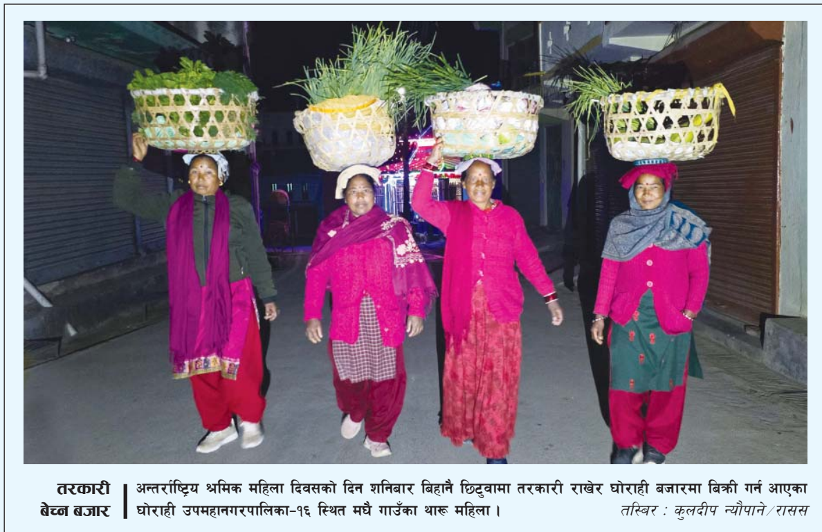
तरकारी अन्तर्राष्ट्रिय श्रमिक महिला दिवसको दिन शनिबार बिहानै छिट्टामा तरकारी राखेर घोराही बजारमा बिक्री गर्न आएका बेजना बजार घोराही उपमहानगरपालिका-१६ स्थित मधै गाउँका थारू महिला ।