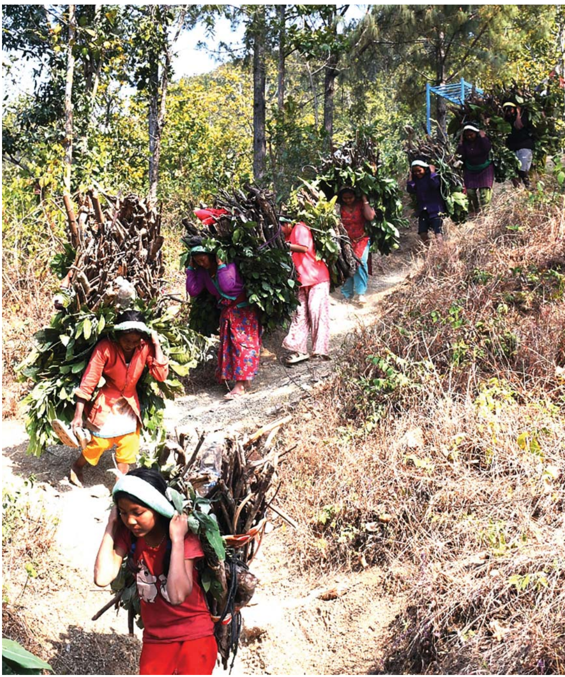
१५औँ अन्तर्राष्ट्रिय महिला दिवसका दिन शनिवार दाङको घोराही उपमहानगरपालिका-१८ स्थित अम्बापुरका स्थानीय महिला घरायसी प्रयोजनका लागि जंगलबाट दाउरा ल्याउँदै।

गेक्कोनिडे परिवारअन्तर्गत पर्ने यी छेपारो संसारभरि ३५० भन्दा बढी प्रजातिका पाइन्छन् भने नेपालमा अहिले फेला परेका तीन नयाँसहित जम्मा पाँच प्रजातिमात्र पाइएको छ। सरकार तथा जैविक विविधता संरक्षण गर्न नेपालका संस्था ठूला स्तनधारी बन्धुजन्तुमा मात्र केन्द्रित रहेकाले नेपालमा अझै थुप्रै प्रजातिको रेकर्ड हुन बाँकी नै रहेको संरक्षणकर्मी बताउँछन्। सरीसृपलगायत अन्य अध्ययन कम भएका प्रजातिको खोज तथा अनुसन्धानका लागि सबै सरोकारवालाले यस्ता प्रजातिको अध्ययन, अनुसन्धान तथा संरक्षणमा प्राथमिकीकरण गर्नुपर्ने देखिएको अध्ययन टोलीको नेतृत्व गरेका भट्टराईले बताए। रासस