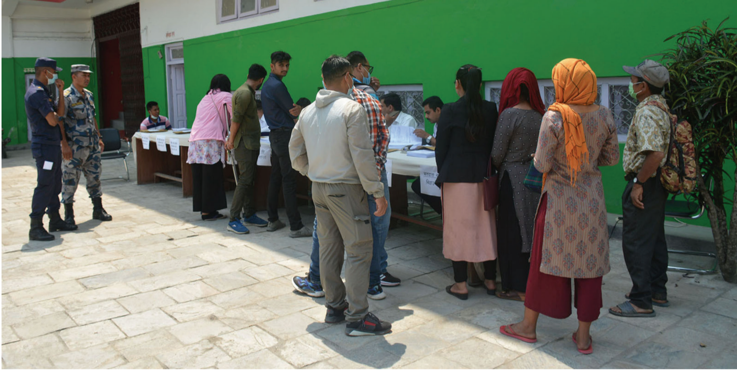
मुख्य निर्वाचन अधिकृतको कार्यालय तनहुँमा आइतबार उम्मेदवारी दर्ता गराउनेको भीड ।