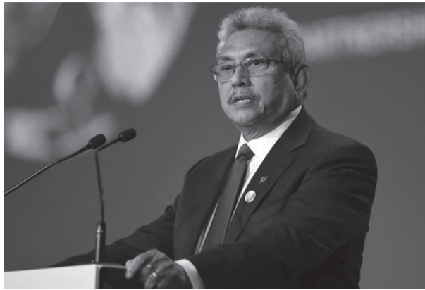
आर्थिक तथा राजनीतिक संकटमा परेको श्रीलंकामा सरकारका कारण संकट उत्पन्न

कोलम्बो- श्रीलंकाका राष्ट्रपति गोटाबाय राजापक्षेले देशभरि लगाइएको संकटकाल खारेज गरेका छन् । मंगलबार मध्यरातदेखि लागू हुनेगरी संकटकाल हटाउने निर्णय गरिएको हो । आन्दोलनमा उत्रिएका नागरिकले राष्ट्रपतिनिवास घेराउ गर्दै नारावाजी गरेपछि सरकारले देशव्यापी संकटकालको घोषणा गरेको थियो । 'सार्वजनिक सुरक्षालाई ध्यान दिँदै लागू गरिएको संकटकाल हटाउने निर्णय भएको छ,' राष्ट्रपति राजापक्षेले भने ।