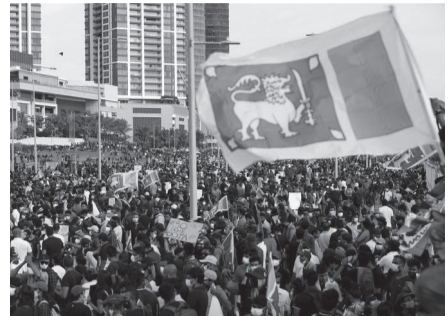
रोक लगाएको कारणले गर्दा विदेशी मुद्राको अभाव भएकाले मन्दी आएको हो। यसले देशलाई पर्याप्त इन्धन किन्न असमर्थ बनाएको छ। मानिसले खाद्यान्न र आधारभूत आवश्यकता जस्तै इन्धन र ग्यासको तीव्र अभावको सामना गरिरहेका छन्। रासस/एएनआई

कोलम्बो- श्रीलंकामा रहेको अमेरिकी दूतावासले कोलम्बोमा हुने सहरव्यापी विरोध प्रदर्शनअघि 'प्रदर्शन चैतावनी' जारी गरेको छ। देशको आर्थिक अवस्थाको विरोध गर्न आइतबार कोलम्बो र वरपर धेरै प्रदर्शन र मार्चको योजना बनाइएको छ। 'प्रदर्शनले कोलम्बोभित्रको यात्रालाई अर्भक कठिन बनाउने र दिनभर सडक बन्द र ट्राफिक जाम निम्त्याउने सम्भावना छ,' अमेरिकी दूतावासले जनाएको छ। श्रीलंकाले सन् १९४८ मा स्वतन्त्रता प्राप्त गरेपछिको सबैभन्दा खराब आर्थिक संकटकको सामना गरिरहेको छ। यसले खाद्यान्न र बिजुलीको अभावसँग जुधिरहेको छ जसले धेरै मानिसलाई असर गरिरहेको छ। अहिले देशलाई आफ्ना छिमेकीबाट सहयोग लिन बाध्य पारिरहेको छ। कोभिड-१९ महामारीको समयमा पर्यटनमा