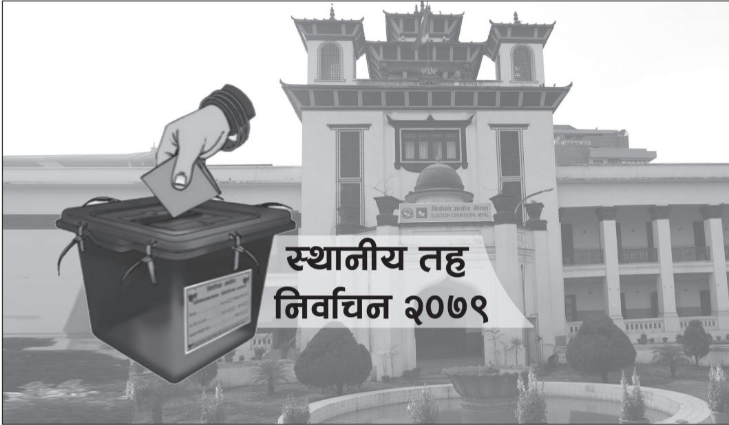
स्थानीय तह निर्वाचन २०७९

काठमाडौं- मुलुक संघीय संरचनामा गएपछि दोस्रोपटक यही वैशाख ३० गते हुन गइरहेको स्थानीय तहको निर्वाचनमा ३५ हजार २२१ पदका लागि कूल एक लाख ५३ हजार २२० जनाले उम्मेदवारी दिएका छन् । विद्यमान कानुनी व्यवस्थानुसार मुलुकमा छ महानगरपालिका, ११ उपमहानगरपालिका, २७ नगरपालिका, ४६० गाउँपालिका र छ हजार ७४३ वडा छन् । यी स्थानीय तहमध्ये महानगरपालिका, उपमहानगरपालिका र नगरपालिकामा प्रमुख/उपप्रमुख, गाउँपालिकामा अध्यक्ष/उपाध्यक्ष, वडाहरूमा वडाध्यक्ष र सदस्य पदमा निर्वाचन हुँदै छ । निर्वाचन आयोगका अनुसार यही वैशाख २९ गतेसम्म १८ वर्ष पूरा भएका कूल मतदाता एक करोड ७७ लाख ३३ हजार ७२३ छन् । तीमध्ये पुरुष मतदाता ८९ लाख ९२ हजार १०, महिला मतदाताको संख्या ८७ लाख ४१ हजार ५३० र अन्य मतदाताको संख्या १८३ रहेको छ ।