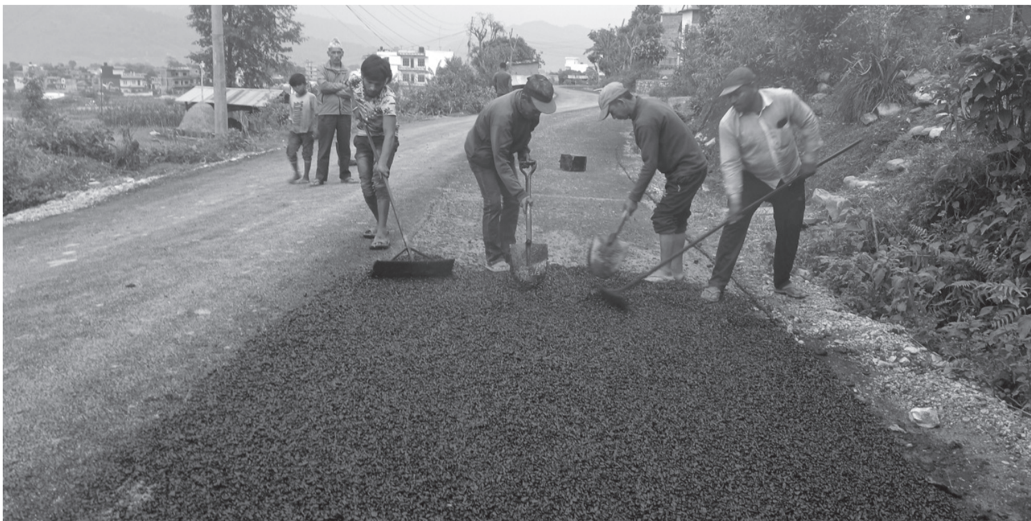
श्रमिक दिवसमा पनि काम | पाल्पा रामपुर नगरपालिका-५, सुन्दरटोलमा सडक कालोपत्रे गर्ने काममा व्यस्त मजदुर । मे १ तारिखका दिन मनाइने अन्तर्राष्ट्रिय श्रमिक दिवसको उनीहरूलाई जानकारी छैन ।