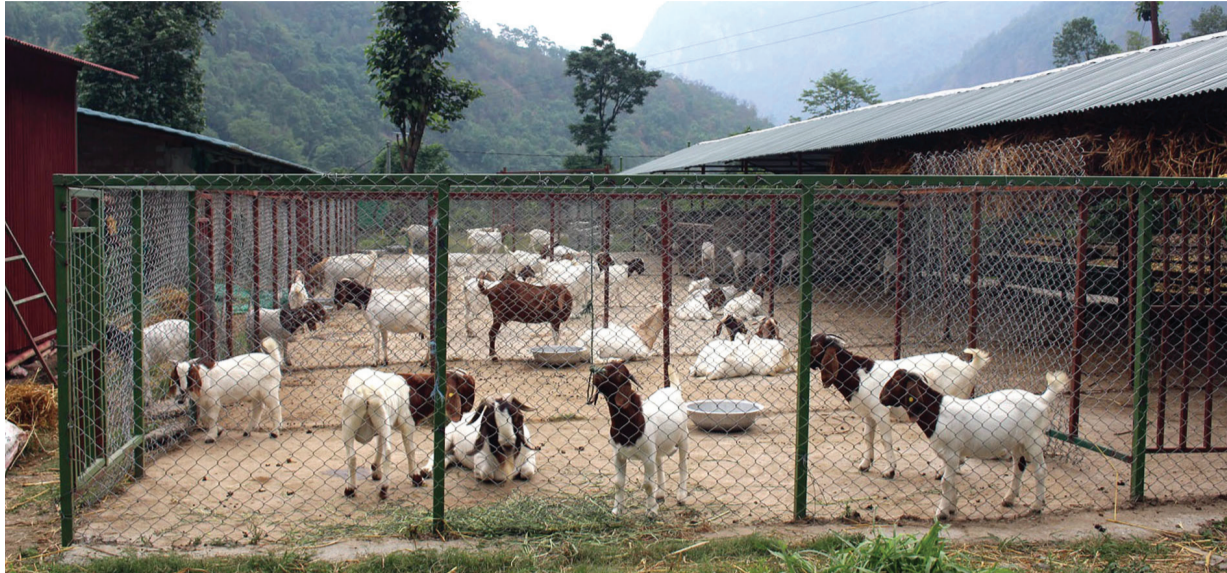
बोयर जातको बास्पापालन म्याग्दीको बेनी नगरपालिका-४ आँगवगरस्थित हरियाली समूहको कृषि फार्ममा पालिएको बोयर जातको बाखा ।