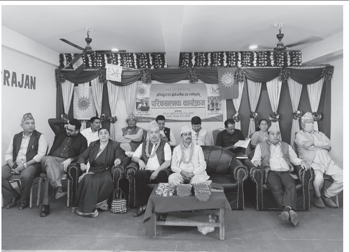
आसन्न स्थानीय तह चुनावमा बागलुङ नगरपालिकामा उम्मेदवारी दिएका नेकपा एमाले र राष्ट्रिय प्रजातन्त्र पार्टीका साभा उम्मेदवारहरूको परिचयात्मक कार्यक्रमका सहभागी ।