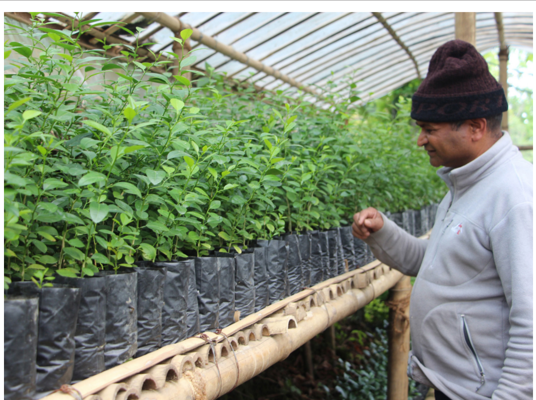
काठमाडौंको बेनी: ताप्लेजुडको सदरमुकाम फुङ्लिङ नगरपालिका-७ देखिस्थित एक नर्सरी फार्ममा कागतीको बेनी हेरचाह गर्दै एक किसान। प्रतिवेना १०० रूपैयाँमा विक्रीवितरण गर्दै आएको छ।