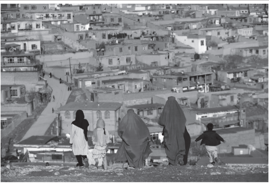
सन् २०१७ को मार्च १६ का दिन बुर्का लगाएका महिलाहरू अफगानिस्तानको काबुलबाट नादिर खान पहाडतर्फ जाँदै। तालिबान शासकहरूले ७ मे २०२२ देखि सबै अफगानी महिलाहरूलाई सार्वजनिक रूपमा सबै शरीर ढाक्ने बुर्का लगाउन आदेश दिएको थियो, जसको अन्तर्राष्ट्रिय समुदायबाट आलोचना भइरहेको छ।