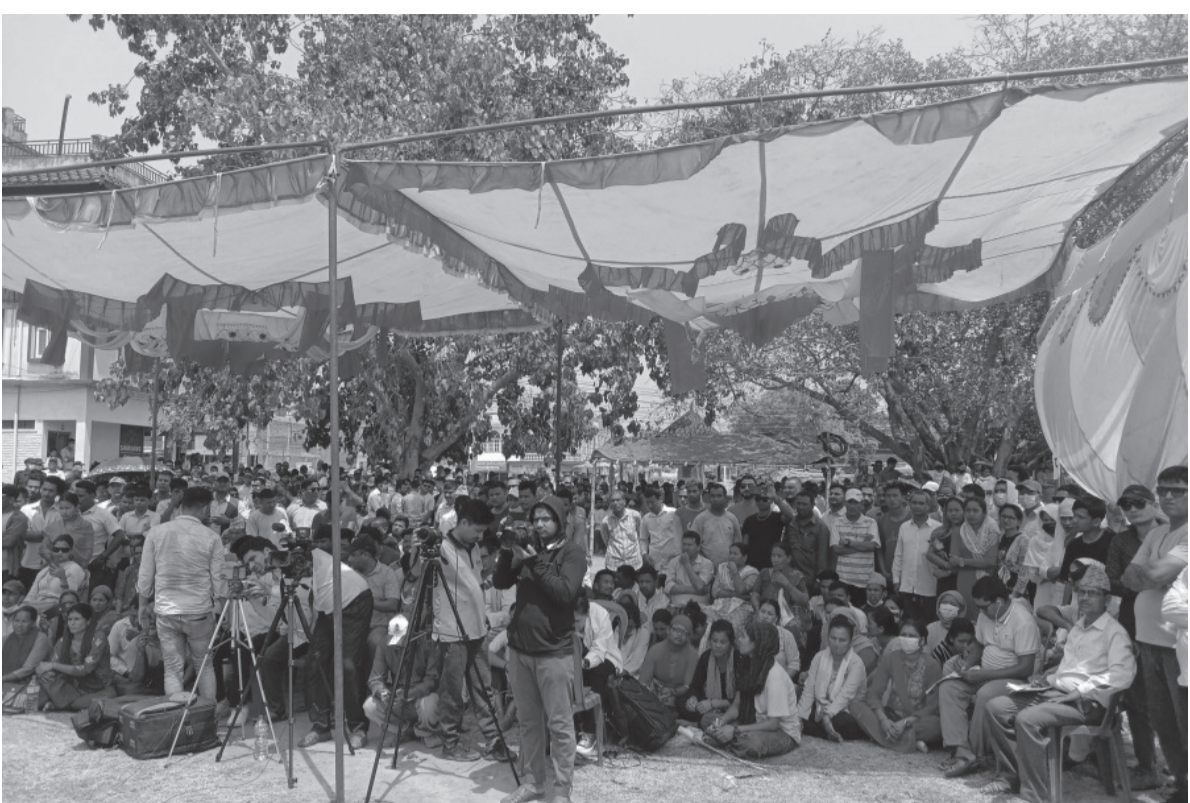
उम्मेदवारका कुरा सुन्दै स्थानीय कैलालीको टीकापुर जेसिसले शनिवार आयोजना गरेको स्थानीय तहको निर्वाचनमा 'टीकापुर नगरपालिकाका मेयर र उपमेयर पदका उम्मेदवारहरूसँग ककस कार्यक्रम' मा उपस्थित स्थानीयहरू।