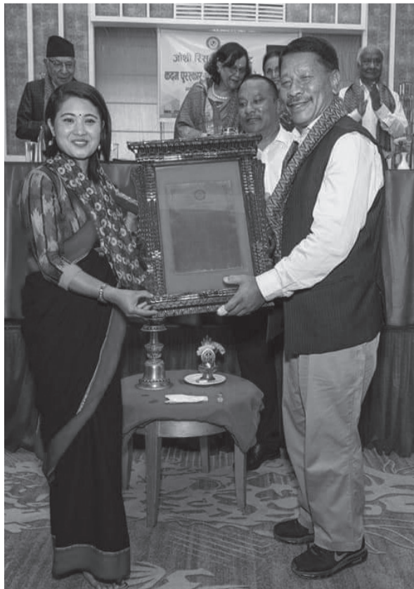
समाजको विकासमा महिलाको