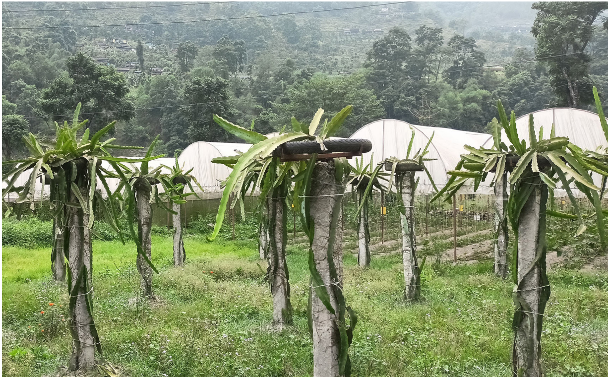
डागन फ्रुट: म्याग्दीको बेनी नगरपालिका-३ सिंगामा हरियाली गुपले गरेको डागन फ्रुटको खेती।