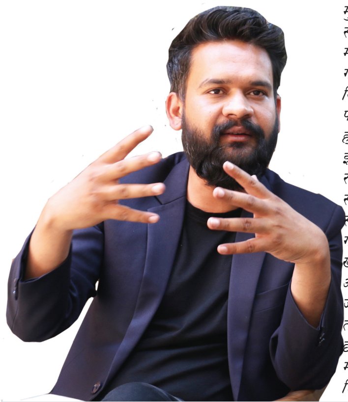
बालेन्द्र शाह, प्रमुख, काठमाडौं महानगरपालिका

काठमाडौंको प्रमुखका रूपमा निर्वाचित हुनुभयो. तपाईंका योजना र प्राथमिकता के-के हुन् ?