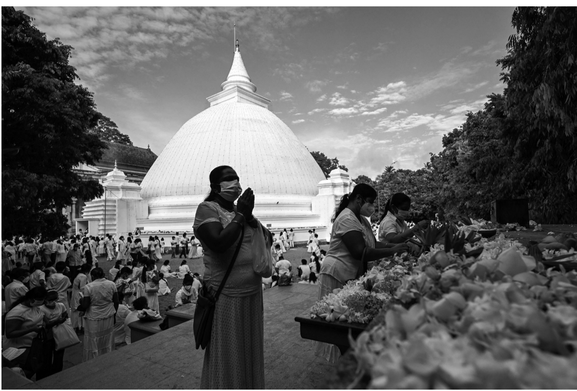
आइतबार वेशाक पर्वको अवसरमा श्रीलंकाको कोलम्बोस्थित मन्दिरमा प्रार्थना गर्दै बौद्ध भक्तहरू। श्रीलंका सरकारले त्यहाँ जारी गरेको देशव्यापी कर्फ्यु बौद्ध धर्मावलम्बीहरूको चाड मनाउन आइतबारको लागि हटाएको छ।