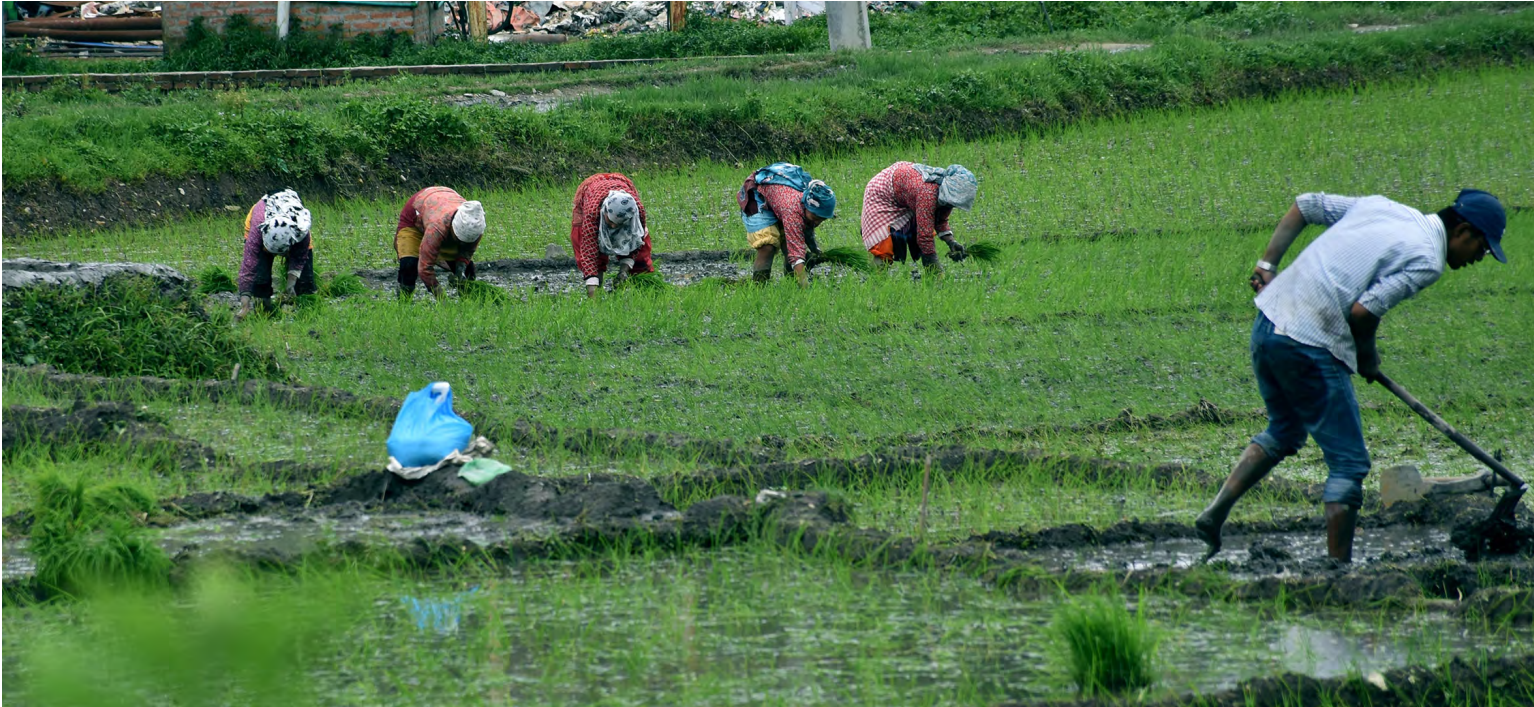
ललितपुर महानगरपालिकाको खोकनास्थित खेतमा धान रोप्दै किसान। आज असार १५ लाई नेपालमा धान दिवसका रूपमा पनि मनाइन्छ।