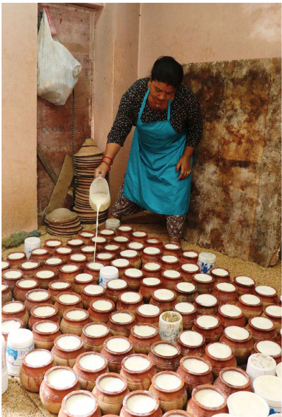
जुजु असार १५ का लागि भक्तपुरमा जुजु धौ बनाउँदै व्यवसायी । नेपाली लोक परम्परा अनुसार आजको दिन रोपाईं महोत्सव गरी दही चिउरा खाने प्रचलनले दहीको माग उच्च हुने गर्छ ।