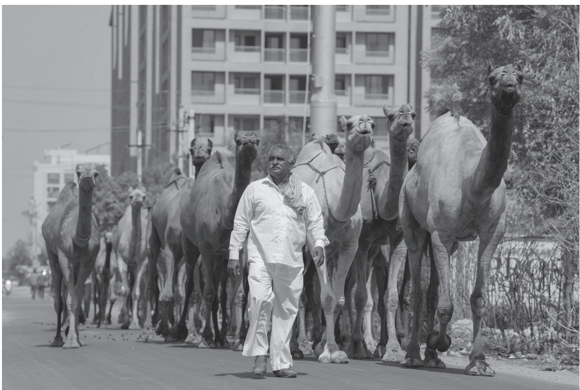
भारतको अहमदाबादस्थित सडकमा आइतबार आफ्नो जँट लिएर हिँड्दै एक व्यक्ति ।