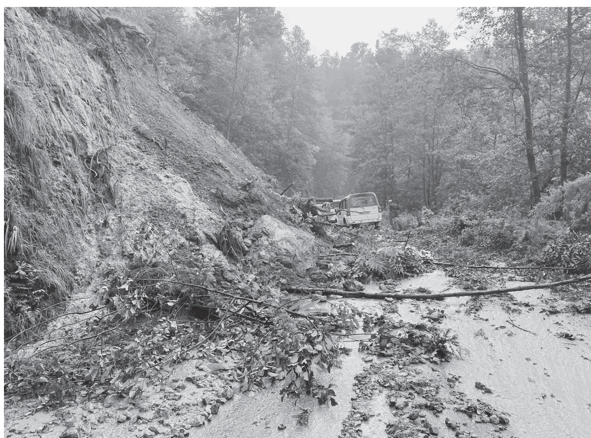
सडक अवरोध बर्षापछि बुधवारराति खसेको पहिरोले अवरोध बनेको मध्यपहाडी पुष्पलाल लोकमार्गको बागलुङ खण्डअन्तर्गत गलकोट-घोडाबाँधे सडक । लोकमार्गको ठाउँठाउँमा खसेका पहिरोका कारण सर्वसाधारणलाई यात्रा गर्न सास्ती भएको छ ।