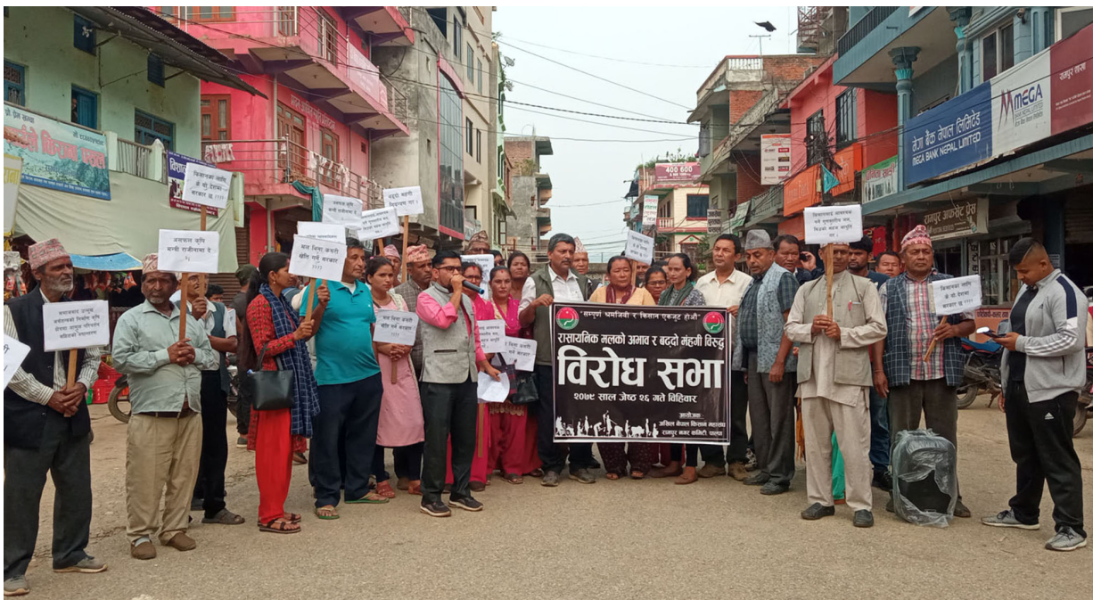
पाल्पाको रामपुरमा रासायनिक मलको अभाव र बढ्दो महँगीबिरुद्ध अखिल नेपाल किसान महासंघ रामपुर नगर कमिटीले आयोजना गरेको विरोध प्रदर्शन।