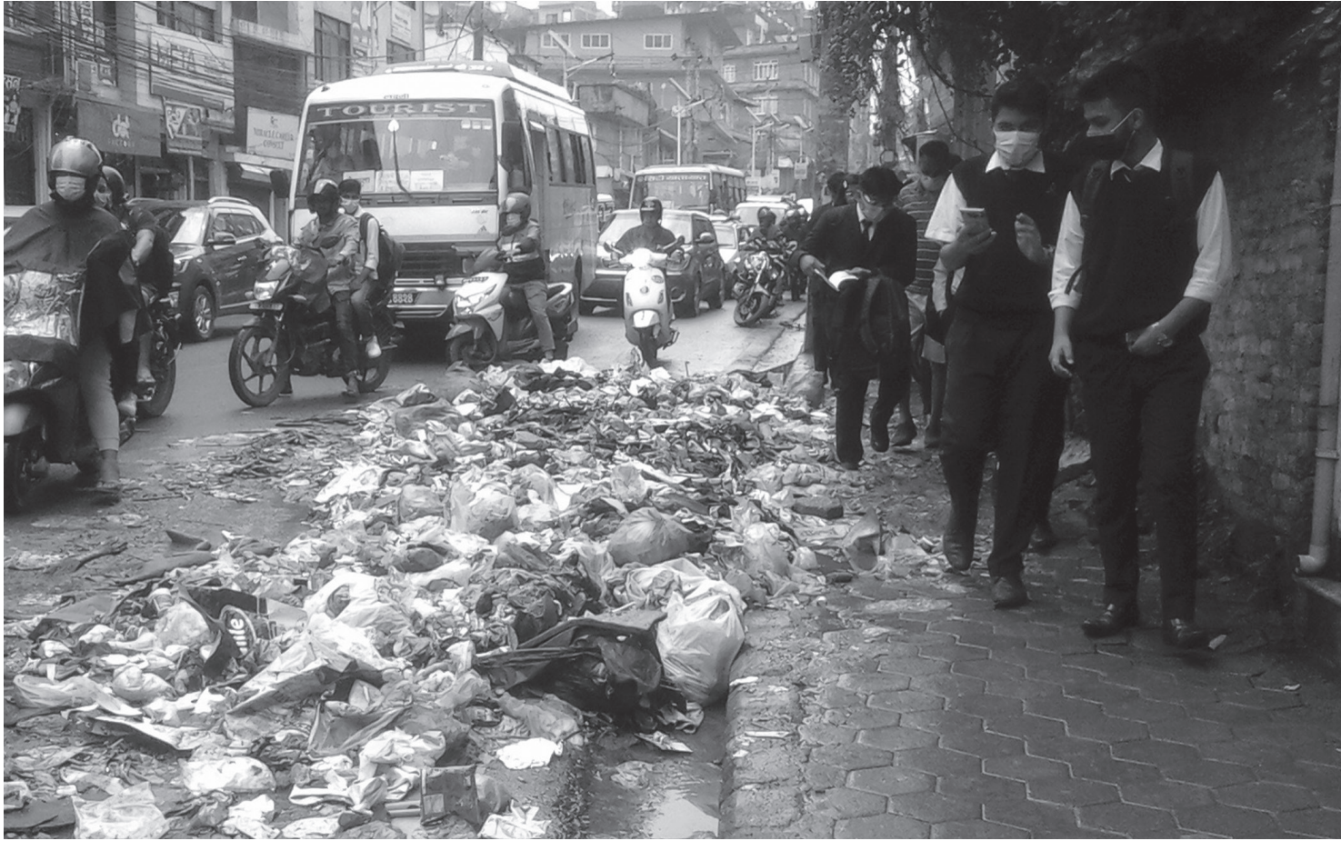
राजधानी काठमाडौंको पुतलीसडकमा सडकपेटिसम्म थुप्रिएको फोहोर । पैदलयात्रु सडकपेटिसम्म थुप्रिएको फोहोर कुल्चेर हिंड्न बाध्य छन् । राजधानीमा लामो समयदेखि फोहोर नउठ्दा जतातै फोहोरको थुप्रो लागेको छ ।