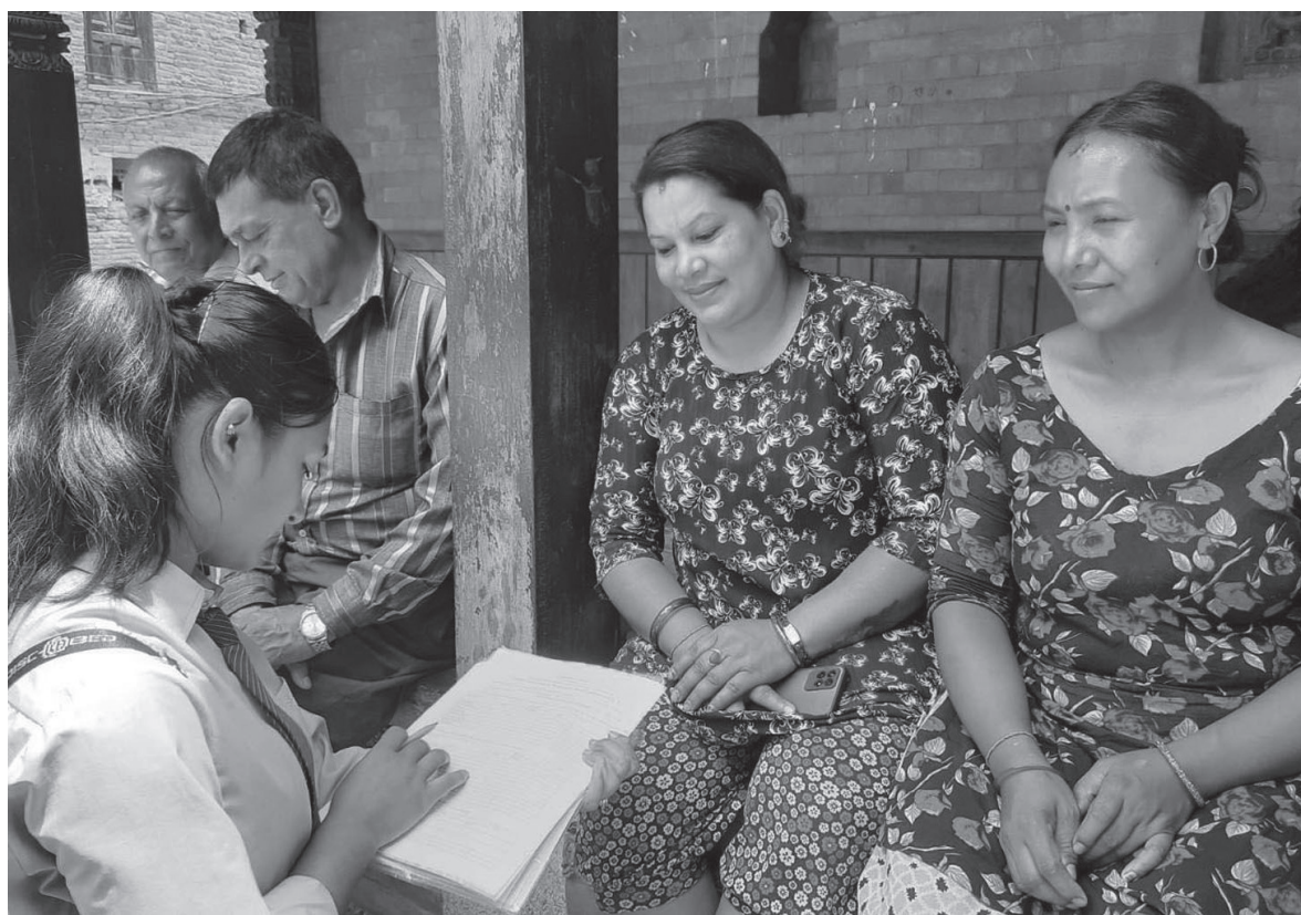
सर्वेक्षण गर्दै भक्तपुर नगरपालिका-९ को 'फोहोरमैला व्यवस्थापन र सामाजिक सम्बन्ध तथा लैंगिक असमानता' विषयमा सामाजिक सर्वेक्षण गर्दै वागीश्वरी कलेजमा अध्ययनरत स्नातक तहका विद्यार्थी ।