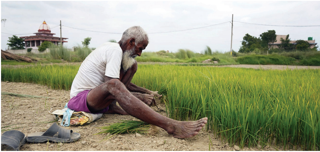
कृषकका दुःख पसाको वीरगञ्ज महानगरपालिकाको वडा नं. ३० लालपसांमा बुधवार सुख्खा परेको खेतबाट धानको बीउ उखेल्दै किसान। समयमा आकासेपानी नपरेको र गण्डक नहरमासमेत साउनको पहिलो साता बिल्नै लागदासमेत पानी नआएपछि पसांमा यस वर्ष धान रोपाइंमा किसानले ठूलो समस्या खेपिरहेका छन्।