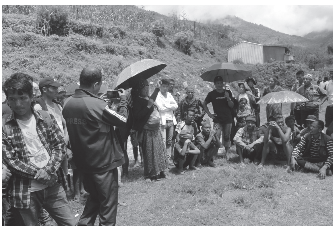
पुनर्वासको पखिडा सुरक्षित पुनर्वासको पखिडा गोरखाको आरुघाट गाउँपालिका-१, मान्छेको स्याम्चेतका पहिरोपीडित । गत बिहीबार भएको पहिरोबाट स्याम्चेत गाउँका २६ घरपरिवार विस्थापित भएका छन् भने दुईवटा घरमा क्षति पुगेको थियो ।