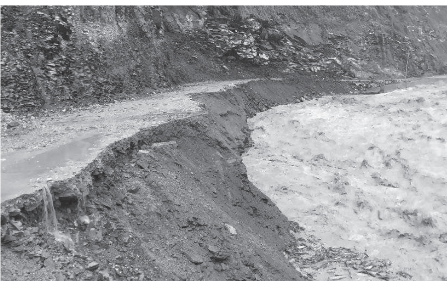
वैकल्पिक सडक नहुँदा पहिरोले सडक बगाएपछि उक्त क्षेत्रका नागरिकलाई समस्या भएको छ । पृथ्वीराजमार्गअन्तर्गत तनहुँको याम्पा-आँबुखैरेनी सडकखण्ड अवरुद्ध भएको छ । मंगलबार राति परेको वर्षाका कारण बुधवार बन्दीपुर गाउँपालिका-५ याम्पास्थित सडकमा पहिरो खस्दा उक्त खण्ड अवरुद्ध भएको हो ।