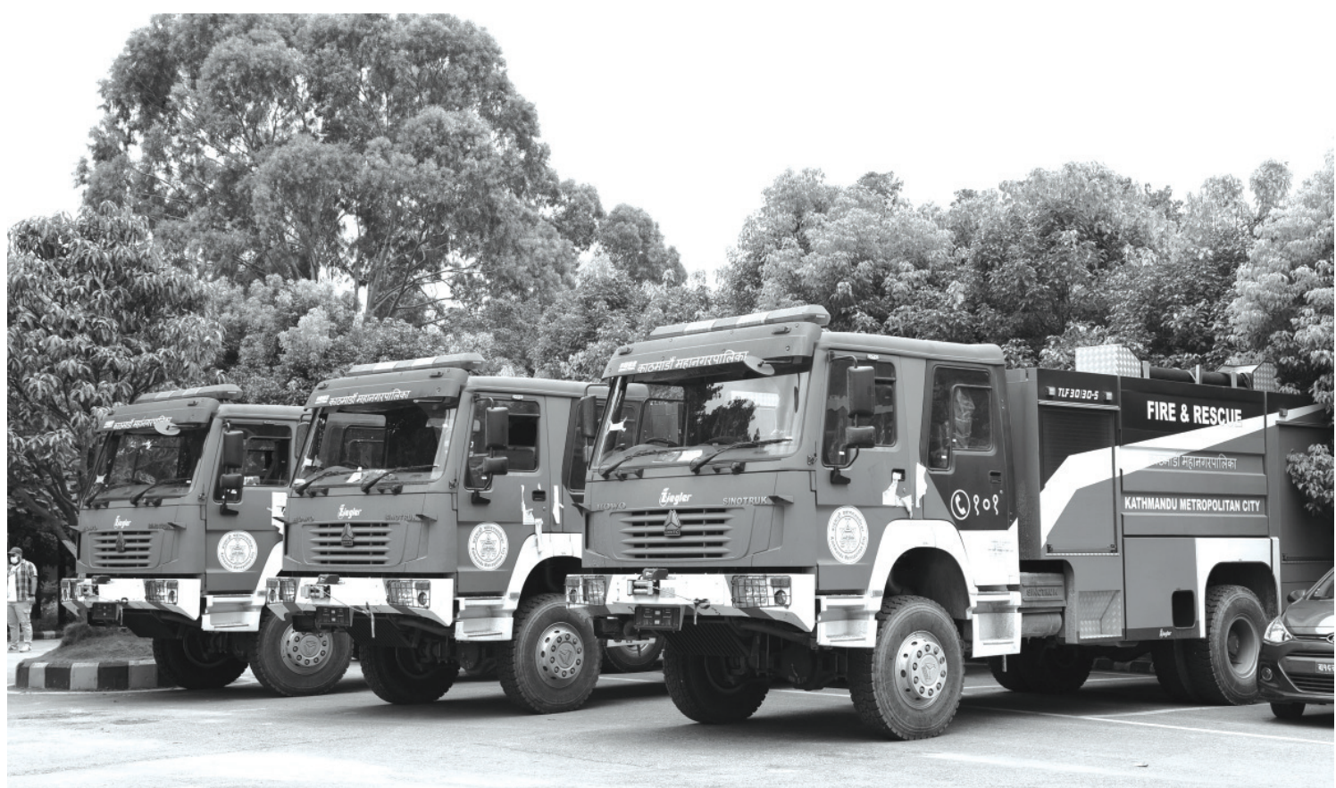
थपिए तीन दमकल काठमाडौं महानगरपालिकाले भित्र्याएका तीनवटा नयाँ दमकल। इण्डोनेसियाबाट ल्याइएका यी दमकलको इन्जिन क्षमता २७० एचपी रहेको छ। दमकलमा प्रतिमिनेट तीन हजार लिटर पानी तान्न र फाल्न सक्ने क्षमता रहेको महानगरले जानकारी दिएको छ।