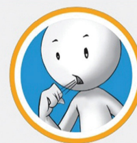
रुघा र खोकी

"नोवेल कोरोना भाइरस प्रभावित देशहरूबाट आउने मानिसहरूमा दुई हप्ता भित्र रुघाखोकी लागेमा, ज्वरो आएमा, घाँटी/टाउको दुखेमा, श्वासप्रश्वासमा अत्याधिक समस्या भएमा तुरुन्त नजिकको स्वास्थ्य संस्थामा सम्पर्क गर्ने ।"