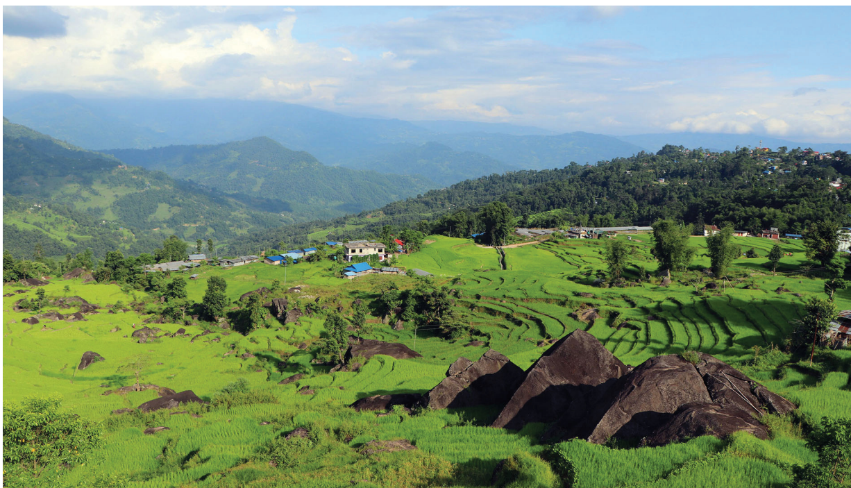
संखुवासभाको खाँदबारी नगरपालिका वडा नं ३ र ४ को सिमानामा रहेको हरियाली धान खेत फाँट । खेतमै पानीको मुल निस्कने भएकोले यहाँ धानलगायतका कृषिजन्य उत्पादन राम्रो फलछ ।