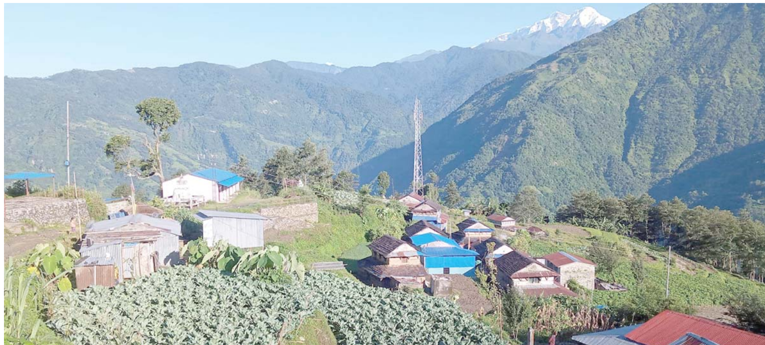
मुस्जे घरवास: मर्याद्वी गाउँपालिका वडा नं. ८ स्थित भुस्मे घरवास तथा सो गाउँमा लगाइएको तरकारी खेती ।