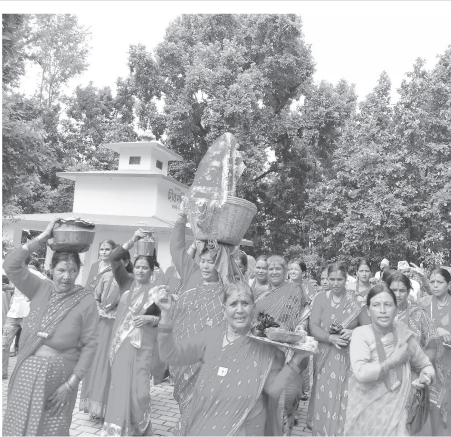
गौरा नचाउँदै ब्रतालु महिला

कैलालीको धनगढी उपमहानगरपालिका-११ वेलामा रहेको शिवमन्दिरमा शनिवार गौरा नचाउँदै स्थानीय ब्रतालु महिलाहरू ।