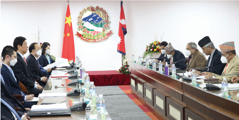
सिंहदरबारमा मंगलबार प्रधानमन्त्री शेरबहादुर देउवासँग भेटवार्ता गर्दै चीनको राष्ट्रिय जनकांग्रेस, स्थायी समितिका अध्यक्ष ली चान्सु नेतृत्वको प्रतिनिधिमण्डल।