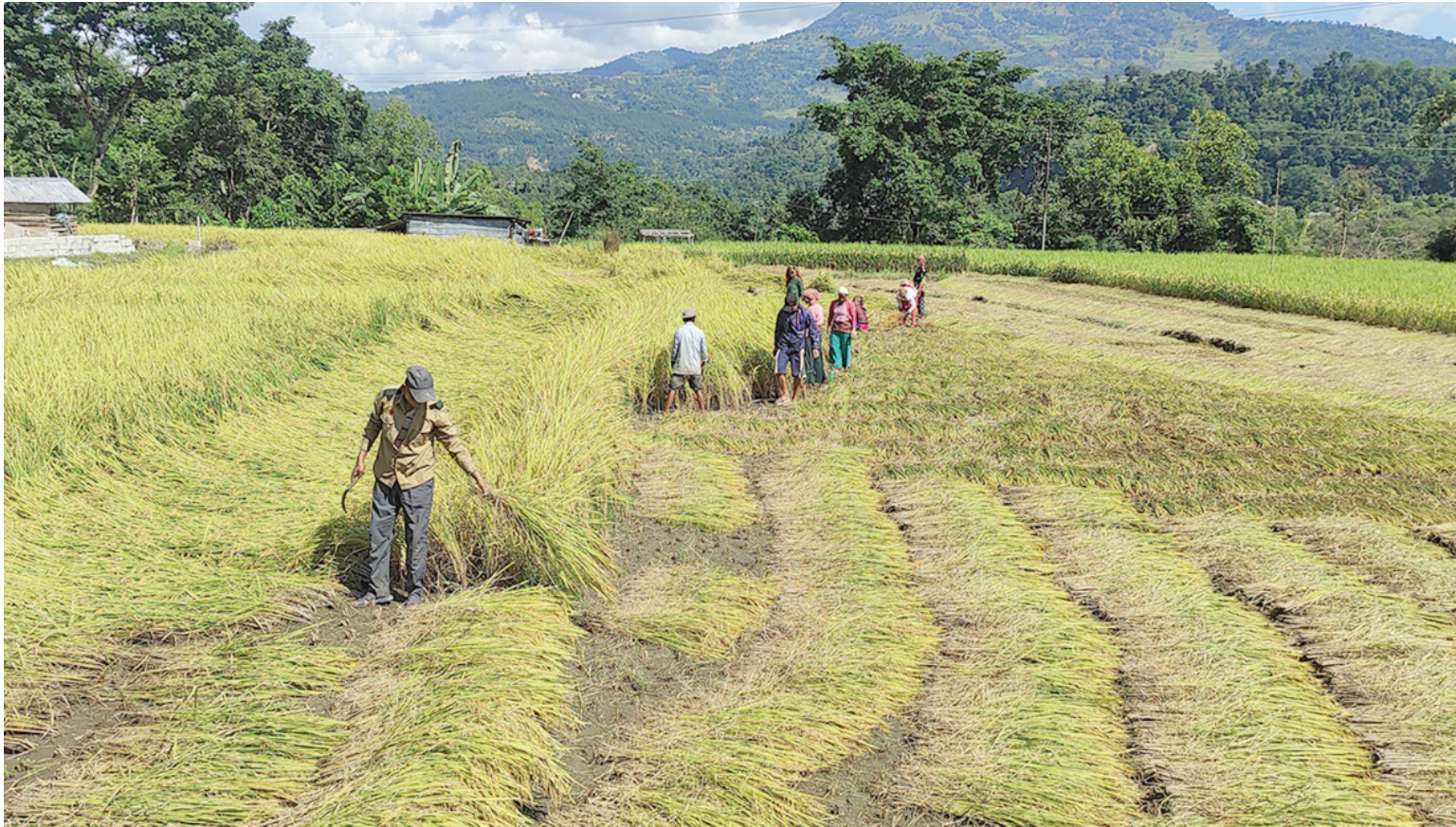
धान काट्दै किसान | तनहुँको भानु नगरपालिका-८ बलेफाँटमा धान काट्दै किसान। भानुका बलेफाँट, वेनीबगर, सेपावगैँचालगायतका क्षेत्र धान पकेट हुन्। यस क्षेत्रमा विशेषगरी तीन पटक धान बाली लाउने गरेको किसान बताउँछन्।