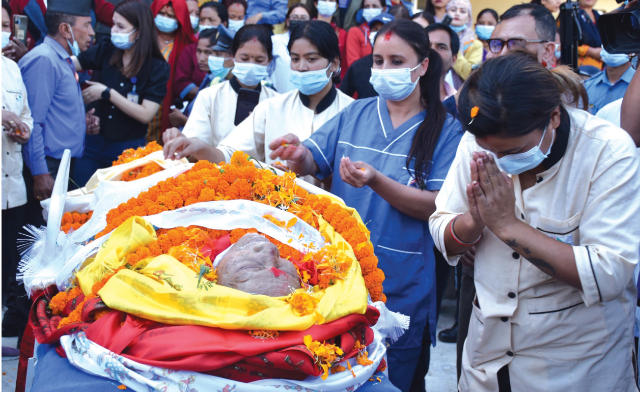
ललितपुरको इमाडोलस्थित किष्ट मेडिकल कलेज तथा शिक्षण अस्पताल परिसरमा राखिएको वाइमय शताब्दी पुरुष सत्यमोहन जोशीको पार्थिव शरीरमा श्रद्धाञ्जली अर्पण गर्दै अस्पतालका स्वास्थ्यकर्मी र सर्वसाधारण।

ललितपुरको ग्वार्कोस्थित किष्ट मेडिकल कलेजमा उपचाररत जोशीको आइतबार बिहान ७ बजेर ९ मिनेटमा निधन भएको हो।