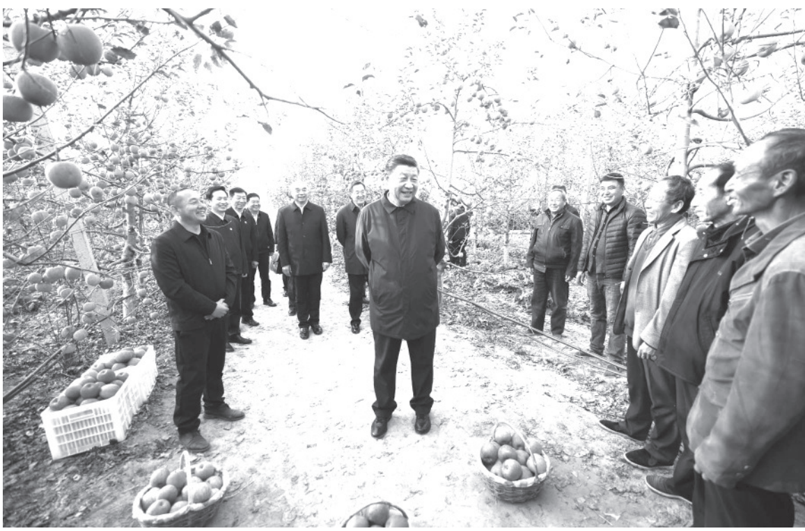
चिनियाँ कम्प्युनिस्ट पार्टीका महासचिव तथा चिनियाँ राष्ट्रपति सी चिनफिङ उत्तरपश्चिम चीनको शान्सी प्रान्तको यान हानको नांगाउ गाउँको बगीचा अवलोकनका क्रममा स्थानीय गाउँलेहरूसँग कुराकानी गर्दै ।