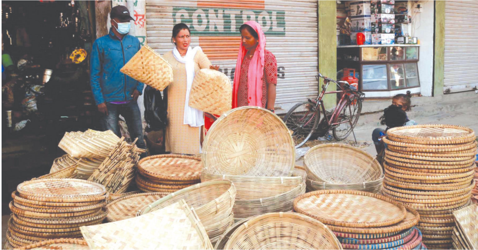
कुनियाको व्यापार सुनसरीको विराटनगर-७ स्थित गुद्री बजारमा छठ पूजाको सामग्री राख्न आवश्यक पर्ने बाँसको चोयाबाट निर्मित कुनिया खरिद गर्दै महिला ग्राहक।