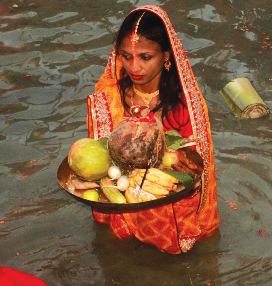
छठी मातालाई प्रसाद अर्पण छठ पर्वको मुख्य दिन आइतबार विराटनगर-६ सरौंचियास्थित सुनसरी मोरङ सिंचाइ आयोजनाको नहरमा अस्ताउँदो सूर्य एवं छठी मातालाई प्रसाद अर्पण गर्दै एक ब्रतालू।