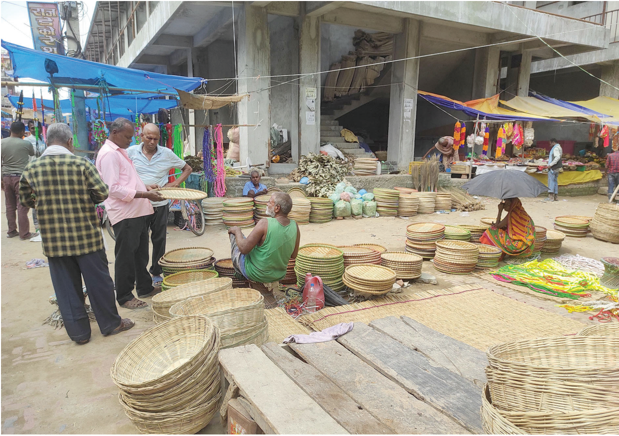
ग्राहकको प्रतीक्षा सप्तरीको राजविराज हटियामा बिक्री गर्न राखिएको बाँसबाट निर्मित ढकिया, कोनियालगायत सामग्री।