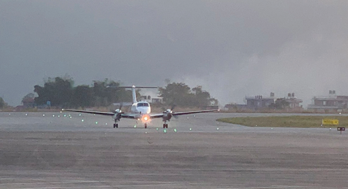
यात्रिक परीक्षण उडान पोखरा अन्तरराष्ट्रिय विमानस्थलमा सोमबार साँझ अवतरण गरेको यात्रिक परीक्षण उडान (क्यालिब्रेसन) एरोथाइको जहाज।