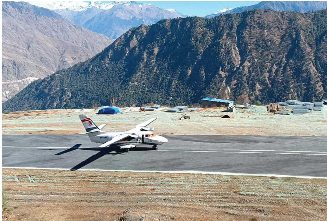
सरकारी स्वमिन्त्वको नेपाल वायुसेवा निगमको जहाजले मुगुको तान्का विमानस्थलमा उडान नगर्दा निजी प्रदायक संस्थाद्वारा सञ्चालित समिट एयरले थोरै संख्यामा उडान भरेपछि यहाँका सर्वसाधारण नेपालराज्य र सुखैत जाने र आउने गरेका छन्।

एक हजार दरका ४३ करोड थान नोटको डिजाइन, छपाइ र ढुवानीको काम भारतीय कम्पनीले नै गर्नेछ। यसका लागि उसले एक करोड ११ लाख ३४ हजार पाँच सय छ अमेरिकी डलर (बुधवारको विदेशी विनिमय दरअनुसार रु एक अर्ब ४५ करोड ६६ लाख २० हजार) बराबर कबोलेको थियो। नेपाल राष्ट्र बैंकको मुद्रा व्यवस्थापन विभागले गत सेप्टेम्बरमा अन्तर्राष्ट्रिय बोलकबोल प्रतिस्पर्धाबाट कम्पनी छनोटका लागि ठेक्का प्रस्ताव आह्वान गरेको थियो। त्यसमा ब्राजिल, चीन र फ्रान्सका कम्पनीले पनि प्रस्ताव हालेका थिए तर आर्थिक र प्राविधिकरूपमा उपयुक्त रहेको भन्दै भारतीय कम्पनी छनोटमा परेको हो।