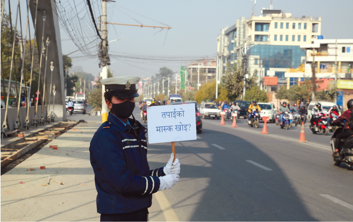
मास्क खोइ? कोभिड-१९ को संक्रमणबाट बच्नका लागि मास्कको अनिवार्य प्रयोग गर्न यात्रुलाई सचेत गराउँदै ट्राफिक प्रहरी (समाचार पृष्ठ २ मा)।

वर्ष ९ अंक २३९ काठमाडौं शुक्रवार, १५ पुस २०७९ Prabhav National Daily Friday, December 30, 2022 www.prabhavonline.com पृष्ठ ८ मूल्य रु. ५१-