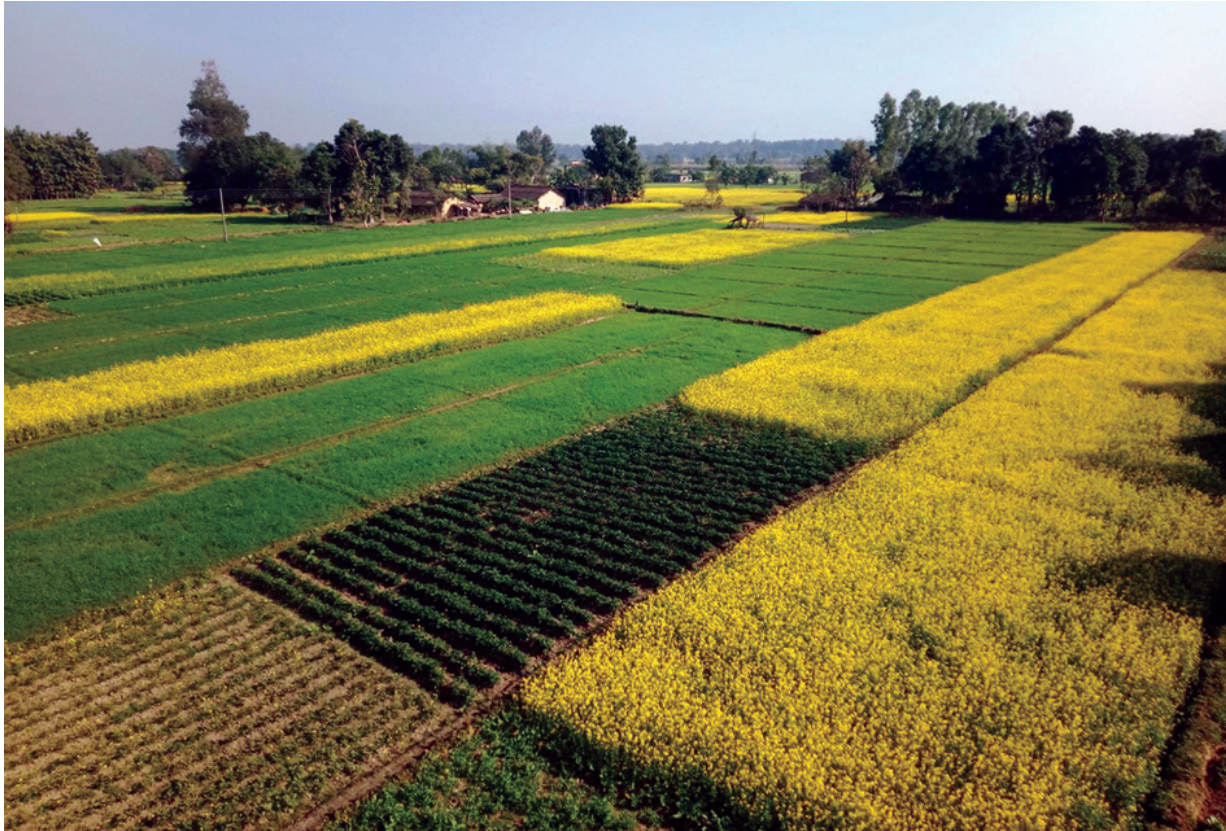
शुक्लाफाँटा नगरपालिका-३ जोनापुरका किसानले खेतमा लगाएको तोरी, गर्हुँ र आलु खेती।