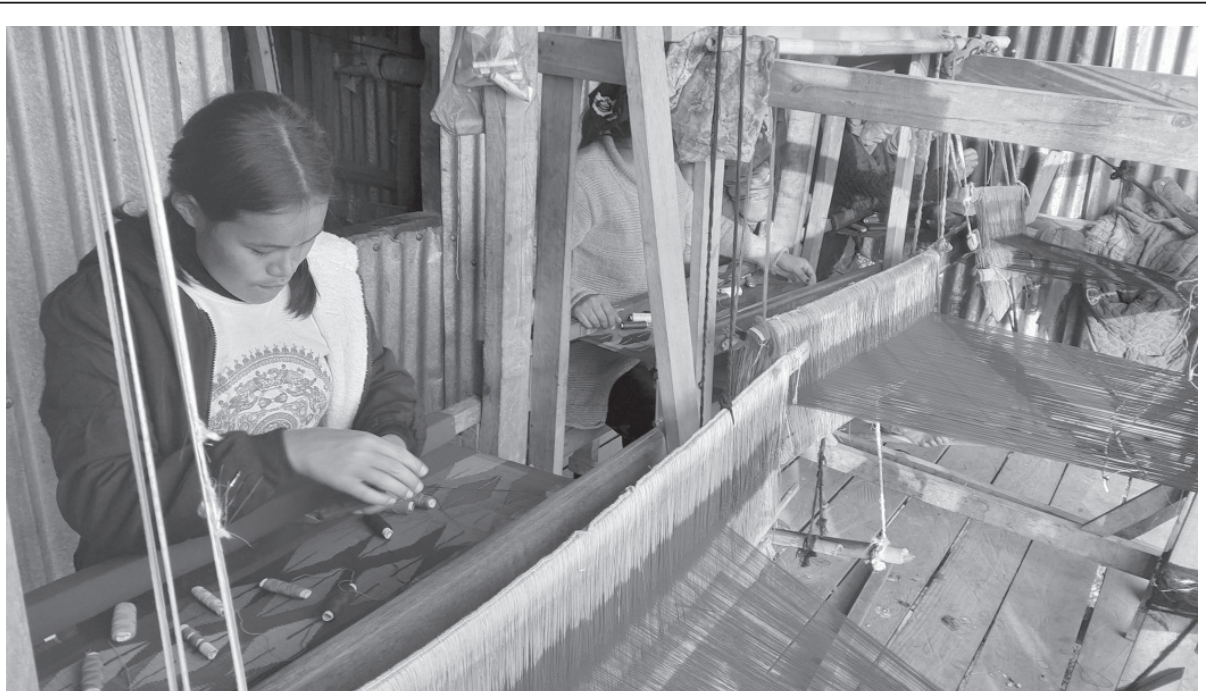
ढाकाको कपडा | ताप्लेजुङको फुड्लिङ नगरपालिका-७, दोखुस्थित सोनी ढाका कपडा उद्योगमा ढाकाको कपडा बुन्दै उद्यमी।