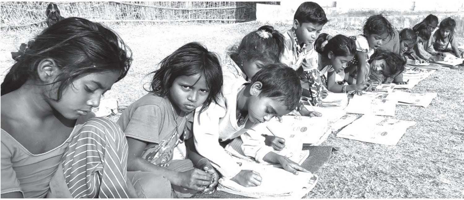
चौरमा पढ्दै बालबालिका | सप्तरीको हनुमाननगर कंकालिनी नगरपालिका-११, इनरुवास्थित दलित राष्ट्रिय आधारभूत विद्यालयका विद्यार्थी विद्यालयपरिसरको चौरमा घाममा बसेर पढ्दै।