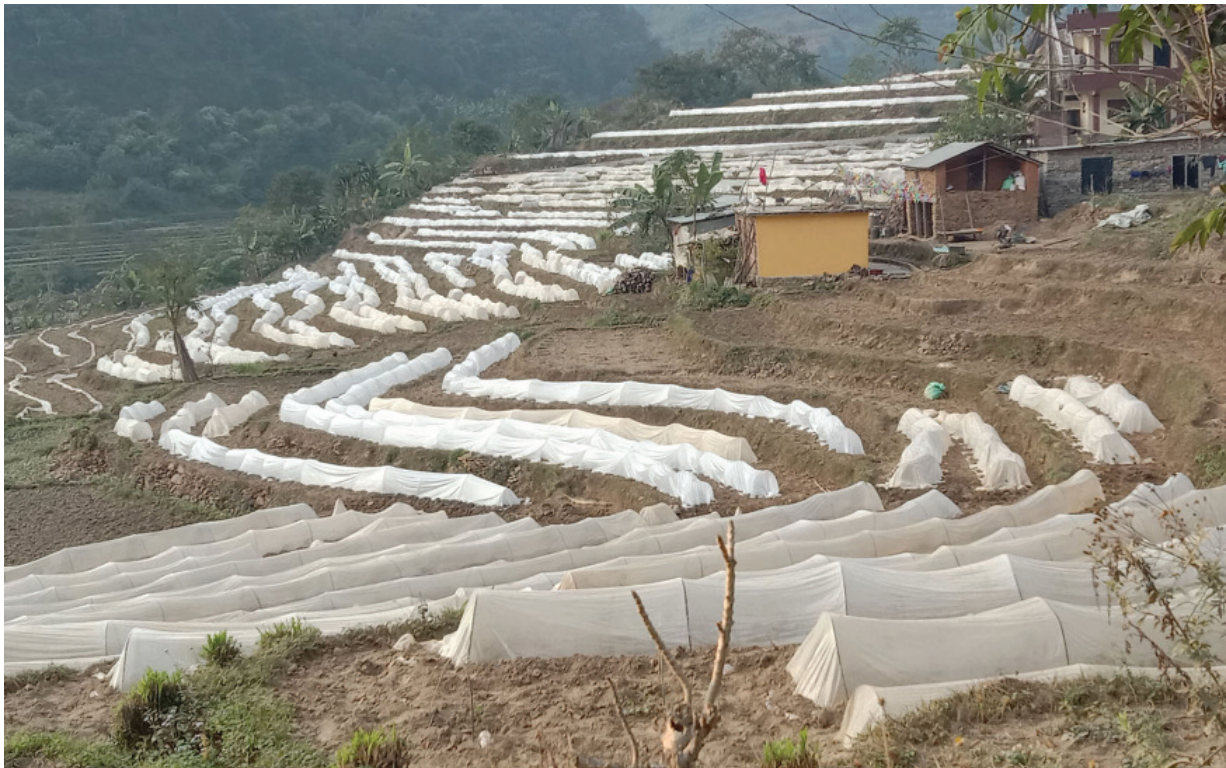
टोलेलमा धादिङको बुडचुङ क्षेत्रका किसान फिन हाउसमा बेमौसमी तरकारी फलाउन टोलेलमा बिरुवा उमाउँदै ।