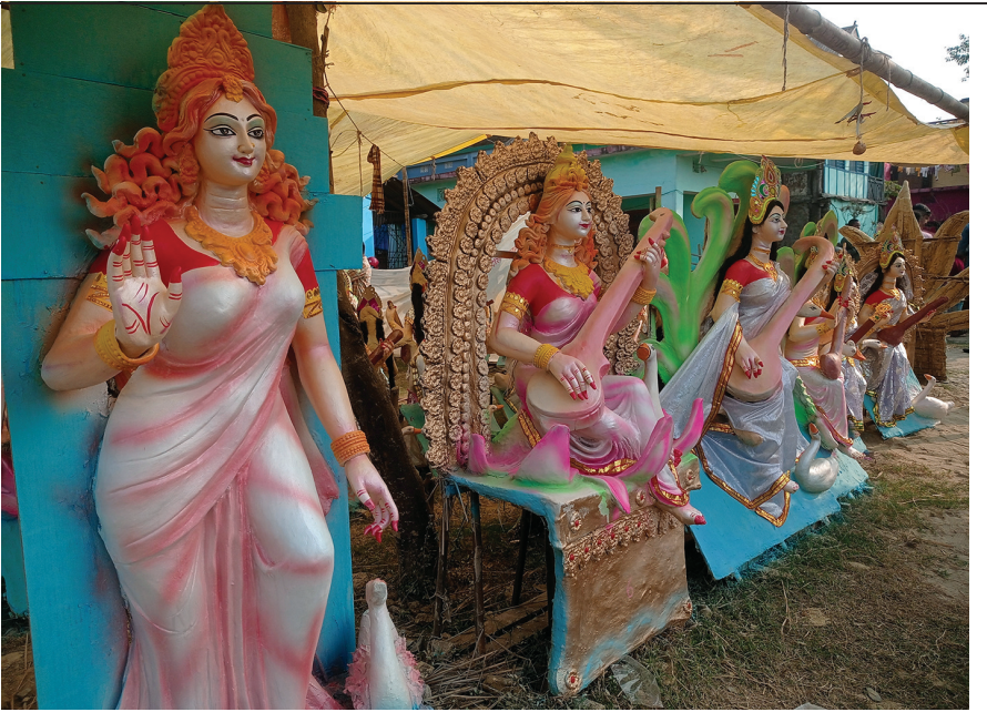
माता इनरुवामा विक्रीका लागि राखिएका सरस्वतीको मूर्ति । मूर्ति दुई हजार ५०० देखि १७ हजार सरस्वती सम्ममा विक्री हुने कालिगढ विनोद यादव बताउँछन् ।