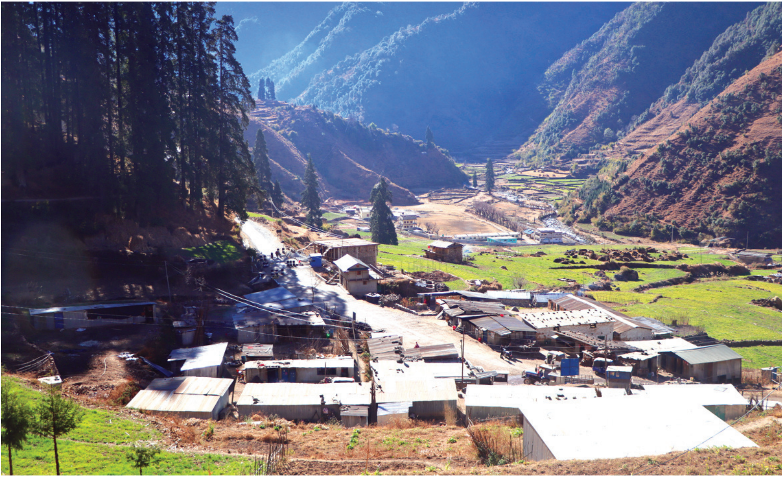
बस्ती विस्तार पूर्वी रुकुमको भूमे गाउँपालिका-१ लुकुममा तीव्र बस्ती विस्तार हुँदै । राष्ट्रिय गौरवको आयोजना मध्यपहाडी लोकमार्गले जोडिएपछि यहाँ बस्ती विस्तार हुन थालेको हो ।