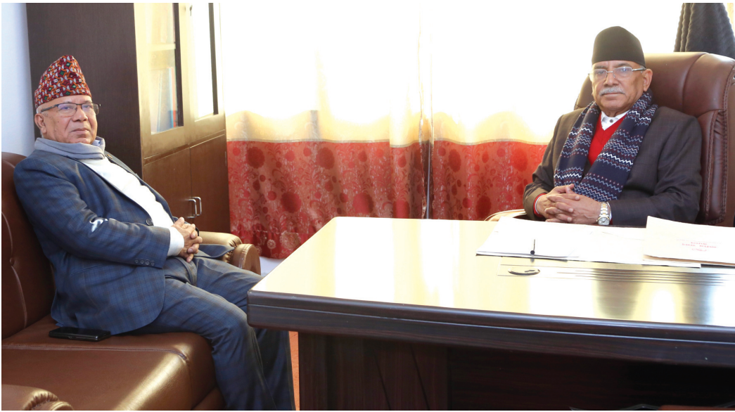
नेकपा एकीकृत समाजवादीका अध्यक्ष माधवकुमार नेपालसँग बुधवार सिंहदरवारमा विश्वासको मत माग्दै प्रधानमन्त्री पुष्पकमल दाहाल।

काठमाडौं- प्रधानमन्त्री पुष्पकमल दाहालले यही २६ पुसमा विश्वासको मत लिँदै छन्। वर्तमान गठबन्धनमा कुनै समस्या नआए सहजै विश्वासको मत पाउने अवस्था छ। तर, उनी त्यसमा दुक्क छैनन्। आफूलाई समर्थन नगरेका दलहरूबाट पनि विश्वासको मत लिने प्रयासमा दाहाल लागेका छन्। त्यसकै लागि उनले दलका नेताहरूसँग भेटवार्ता गरिरहेका छन्। दाहालले नेकपा एकीकृत समाजवादी (एस), लोकतान्त्रिक समाजवादी पार्टी (लोसपा)देखि राष्ट्रिय जनमोर्चा/गायतका दलहरूसँग विश्वासमा लिन खोजेका हुन्। नेकपा एसका अध्यक्ष माधवकुमार नेपाललाई आफू नेतृत्वको दल नेकपा माओवादी केन्द्रको सिंहदरवारस्थित संसदीय दलको कार्यालयमा बुधवार भेटवार्ता गरी प्रधानमन्त्री दाहालले संसद्मा विश्वासको मत दिन आग्रह गरे। जवाफमा नेपालले सरकारको न्यूनतम साभ्ना कार्यक्रमका आधारमा विश्वासको मत दिने/नदिने निर्णय २६ गतेकै दिन गरिने बताएको दाहालको सचिवालयले जनाएको छ। दाहालसँग नेपालले विश्वासको मत दिन आफ्नो पार्टीलाई केही असहज भएको बताएका थिए। उनले असहज भएको सत्तारूढ गठबन्धनमा नेकपा एमाले भएकाले भनेका हुन्। उक्त दलका अध्यक्ष केपी शर्मा ओलीले दुईपटक संसद् विघटन गर्नुलाई नेपाल र दाहालले प्रतिगमन भनेका थिए। फेरि, सोही दलबाट विभाजित भएर नेपालको दल बनेको हो। नेपाल र ओलीबीच अझैसम्म राजनीतिक सम्बन्ध सुमधुर छैन। सोही कारण नेपालले प्रधानमन्त्री दाहाललाई विश्वासको मत दिने कुरा सुलेर भन्न नसकेका हुन्।