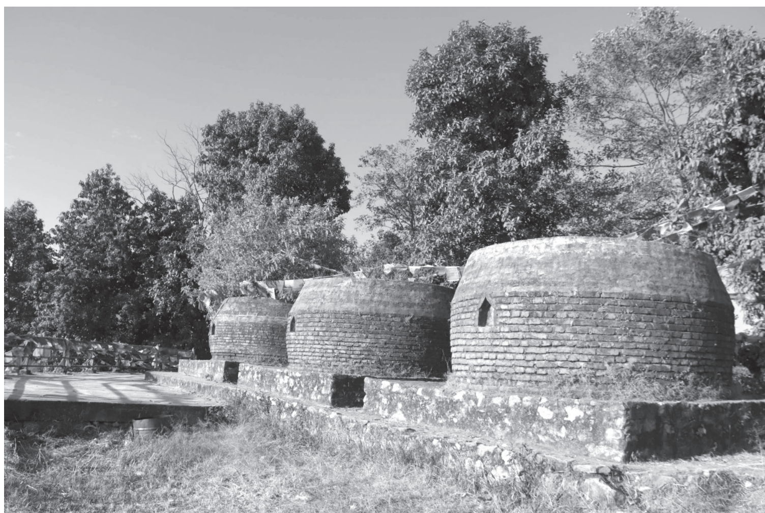
पाँचगाढो | तारकेरवर नगरपालिका-३ को धार्मिक एवं पर्यटकीयस्थल पाँचगाढो। बुढको उपमा पाएका अतिशय दीपकर केरुङको बाटो टिक्न जाने क्रममा सन् १०४० मा जितपुरफेरी पुगेका थिए। त्यहाँ केही समय बिताउँदा उनले पाँचवटा माने (बुढको थुम्का) स्थापना गरेको इतिहास छ।