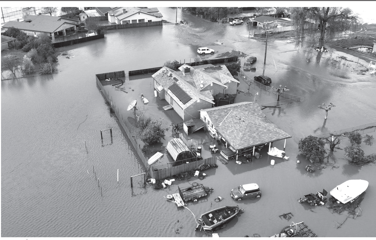
अमेरिकाको क्यालिफोर्नियास्थित प्लानाडामा मंगलबार 'वायुमण्डलीय नदी'बाट आएको बाढीका कारण डुबानमा परेका घरहरूको हवाई दृश्य।