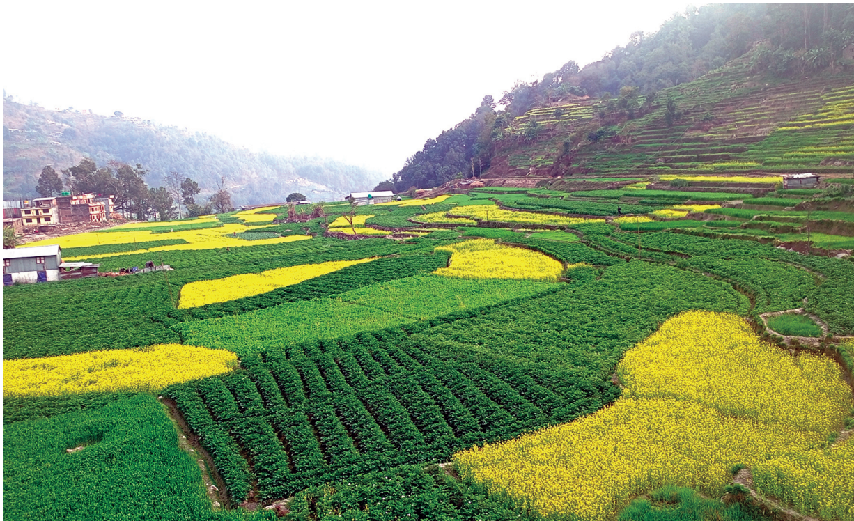
तोरी पहेलै... सिन्धुपाल्चोकको मेलम्ची-११ टारका किसानले लगाएको आलु र तोरी। यस क्षेत्रको मुख्य बालीमा आलु, धान, तोरी रहेका छन्।