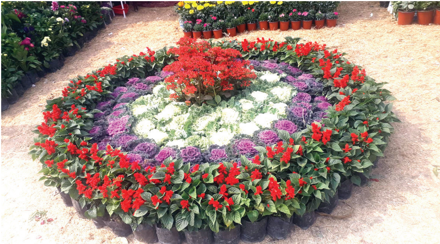
फूलको सजावट फ्लोरिक्ल्चर एसोसिएसन नेपाल सुनसरीले धरानमा बुधवारदेखि सञ्चालन गरेको पुष्प प्रदर्शनी मेलाका सजाएर राखिएको फूल ।