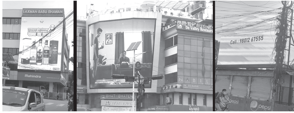
काठमाडौंको त्रिपुरेश्वर, नक्सालगायत स्थानमा राखिएका डिजिटल बोर्ड ।