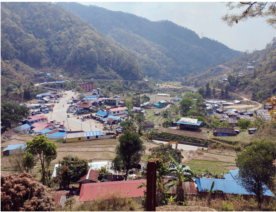
सिन्धुलीको चियाबारी बिपी राजमार्ग सञ्चालना अघिपछि फेरिएको सिन्धुलीको कमलामाई नगरपालिका-२ स्थित चियाबारी। राजमार्ग दायर्यायाँ बस्तीको विकास भएसँगै स्थानीयवासीले सुरुआत गरेको व्यापार, व्यवसाय फस्टाउँदै गएको छ।