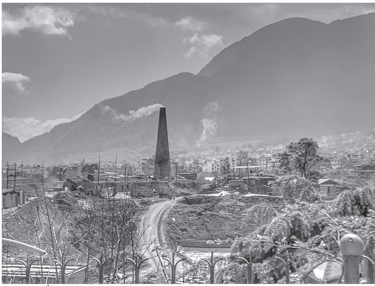
वायु प्रदूषणको स्रोत चन्द्रागिरि नगरपालिका-१० सतुंगलमा रहेको ईटाभट्टामा काँचो माटोबाट बनेको ईटा पोल्ने । यी भट्टाबाट निस्कने धुँवाँ धुलोले राजधानीमा वायु प्रदूषण गराइरहेको भए पनि सरकारले हटाउन सकेको छैन ।