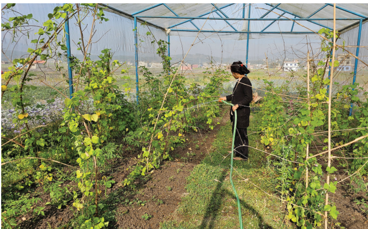
तरकारी सिंचाइ सुर्खेतको वीरेन्द्रनगर-३ मसुरीखेतमा रहेको अनुका कृषि तथा पशुपन्छी फार्मको टनेलमा लगाइएको तरकारी खेतीमा सिंचाइ गर्दै कृषक ।