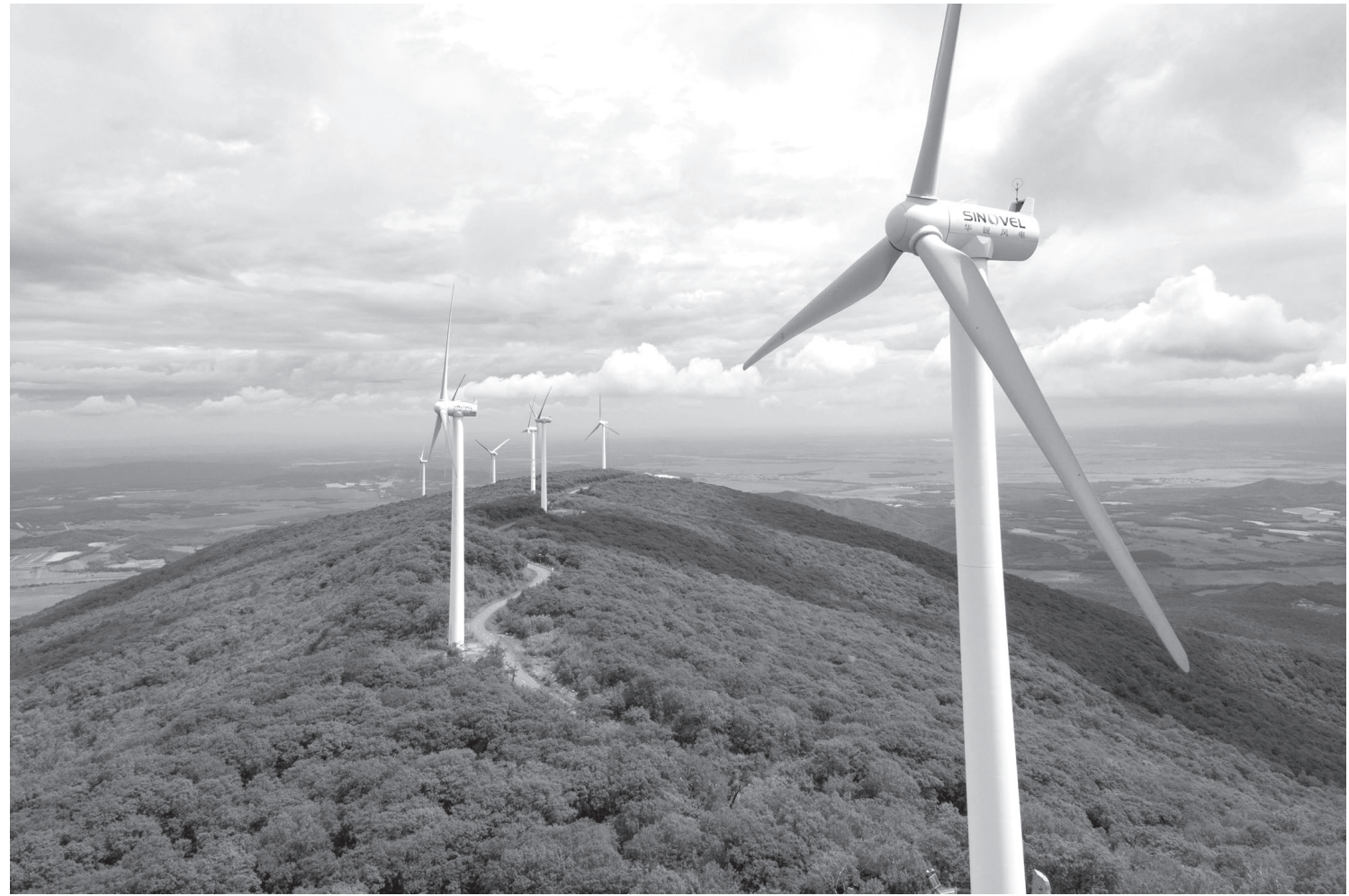
उत्तरपूर्वी चीनको हेल्डजिआड प्रान्तको राओहे काउण्टीस्थित फरेस्ट पार्कमा जडान गरिएका वाइन्ड टर्बाइन (वायु पंखा)हरू। यो हावाबाट विजुली निकाल्ने प्रयोजनका लागि जडान गरिएको हो।