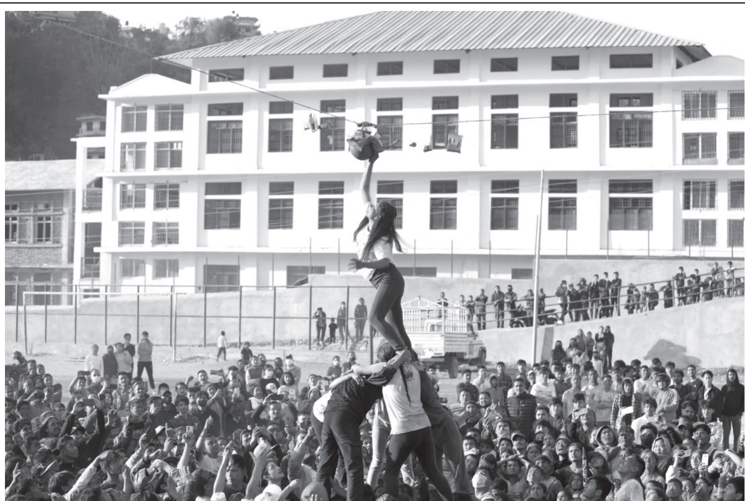
घैटो फूटाउने प्रतियोगिता

फागु पुर्णिमा (होली)को अवसरमा सोमबार गुल्मीको सदरमुकाम तम्घासमा खुकुरी युवा क्लबले आयोजना गरेको घैटो फूटाउने प्रतियोगितामा भाग लिँदै रेसुंगा बहुमुखी क्याम्पसका छात्राहरूको समूह।