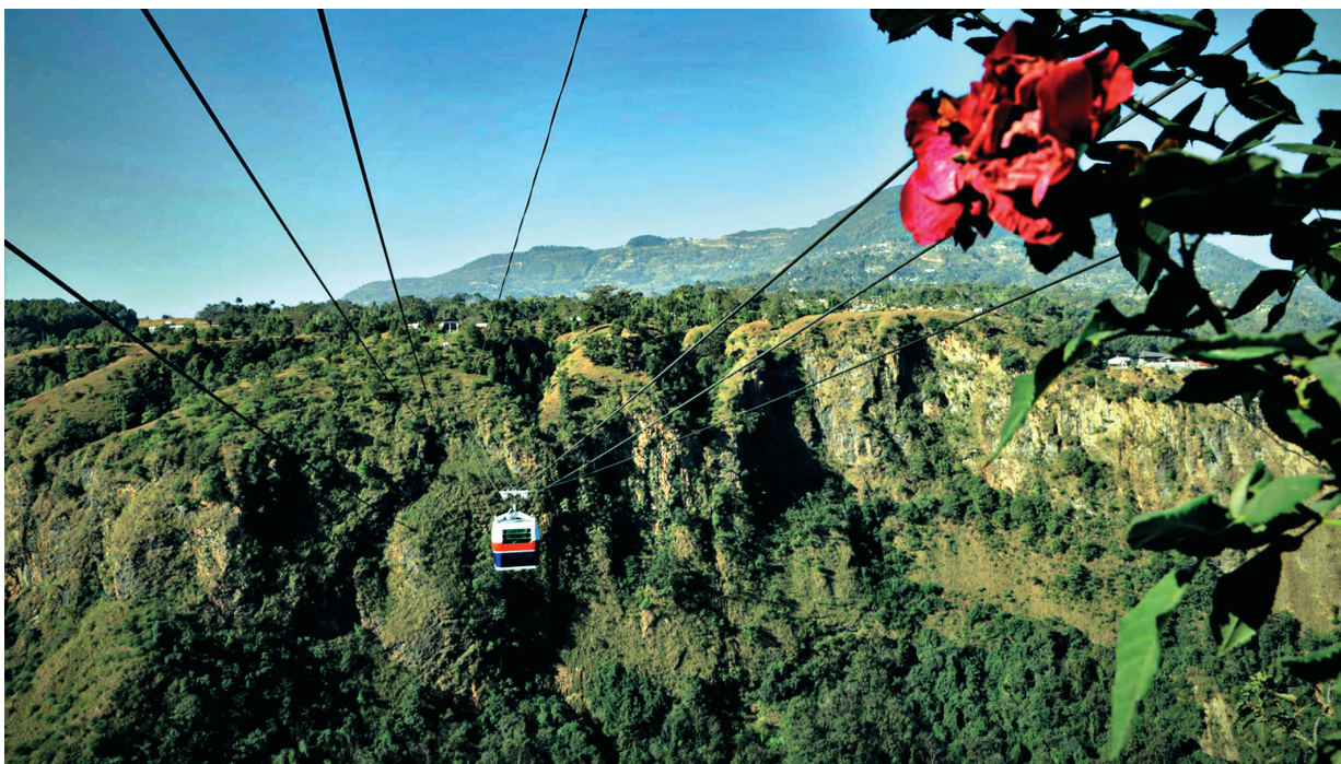
मनमोहन यात्रिक पुल पर्वत उद्योग वाणिज्य संघको अग्रसरतामा कालीगण्डकीको खोँचमाथि करिब पाँच करोड खर्च गरि निर्माण गरिएको 'यात्रिक पुल'। दस वर्षअघि सदरमुकाम कृष्णा र दक्षिण बागलुङका दर्जन बढी गाविसहरूलाई जोड्ने यस पुलमा दैनिक ३०० भन्दा बढी यात्रुले आवतजावत गर्दै आएका छन्।