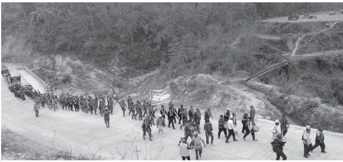
नेपाली सेना पैदलयात्रा | गोरखाबाट जितगढी (बुटवल) सम्म निस्केको नेपाली सेनाको टोली। गोरखाबाट गत चैत २९ गते पैदलयात्रामा निस्केको सेनाको टोली तनहुँ, स्याङ्जा हुँदै शनिवार पाल्पाको रामपुर भित्रिएको छ। रामपुर नगरपालिकाको आयोजनामा टोलीलाई स्वागत गरिएको छ।