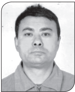
► पदम श्रेष्ठ

सौर्यमासका आधारमा मनाइने देशको एकमात्र जात्रा हो, बिस्का जात्रा । भक्तपुरको भाख्योमा चैत्र मसान्तका दिन नागपताकासहितको लिंगो उठाई वैशाख १ गते (खाइसल्हु) का दिन लिंगो ढाली मनाइन्छ यो जात्रा । विसिका नाग मरेपछि मनाउन थालिएको बिस्का जात्रा भक्तपुरका अलावा मध्यपुर थिमी, टोखा, फुटुङ, गोकर्णमा पनि एकसाथ मनाइन्छ ।