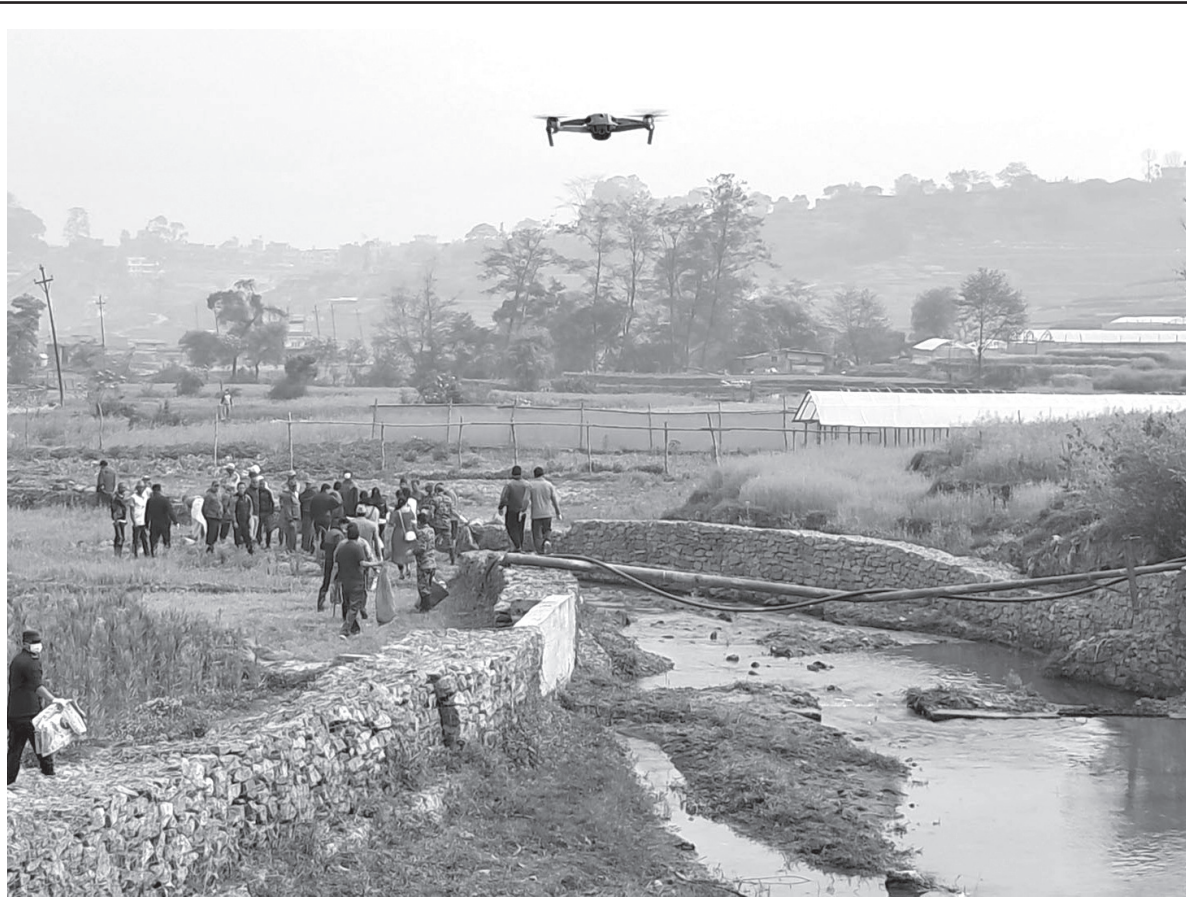
सरसफाई अभियान डिभिजन वन कार्यालय ललितपुरको आयोजनामा शनिवार कर्मनाशा खोला आसपासको क्षेत्र सरसफाई गरिँदै । साथै, सरसफाई अभियानको ड्रोनबाट अवलोकन गरिँदै ।