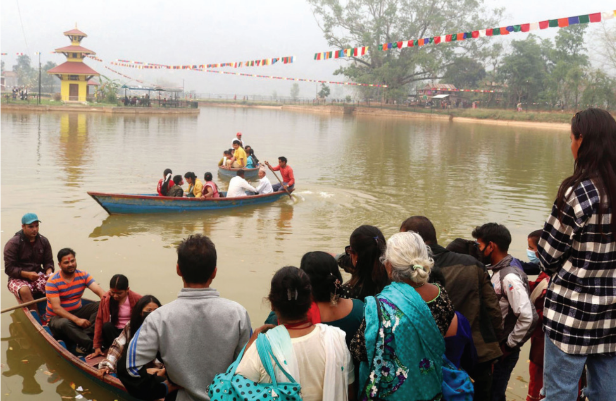
डुंगा चढनेको घुइँचो नयाँ वर्षमा पाल्पा रामपुरको तालपोखरामा डुङ्गा चढ्ने पर्यटकको घुइँचो।