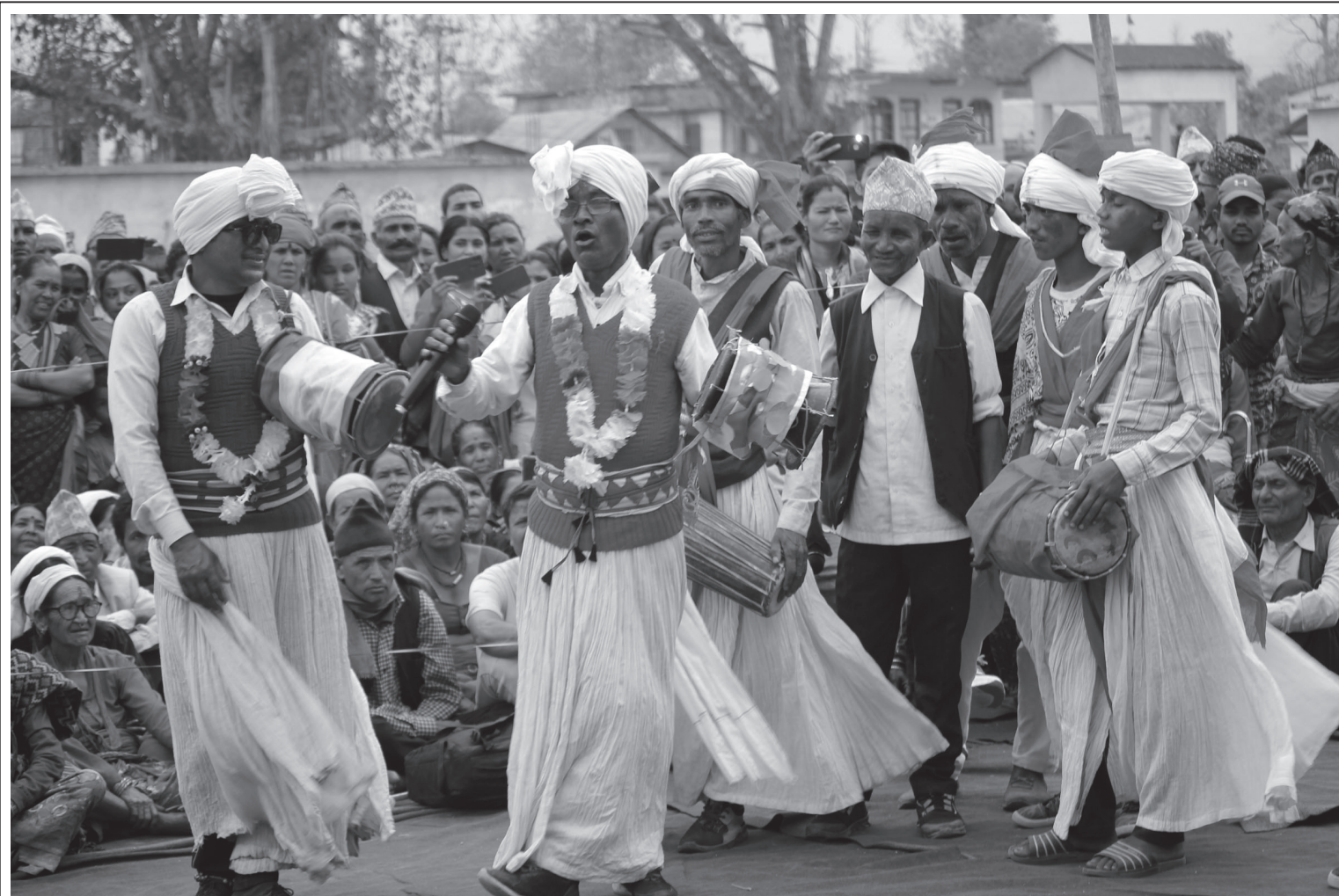
काँकी प्रस्तुत | पञ्चपुरी नगरपालिका-५ बाबियाचौरमा कर्णाली सांस्कृतिक समाज पञ्चपुरीले आयोजना गरेको सांस्कृतिक कार्यक्रमको उद्घाटनमा सांस्कृतिक भौँकी प्रस्तुत गर्दै कलाकारहरू।