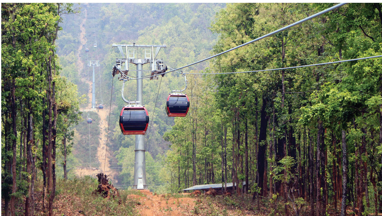
नवलपुर जिल्लाको गैँडाकोट-१ मा निर्माण सम्पन्न मौलाकाली केबुलकार। केबुलकारको वैशाख १८ गते प्रधानमन्त्री पुष्पकमल दाहालले औपचारिक रूपमा उद्घाटन गर्ने कार्यक्रम रहेको छ।