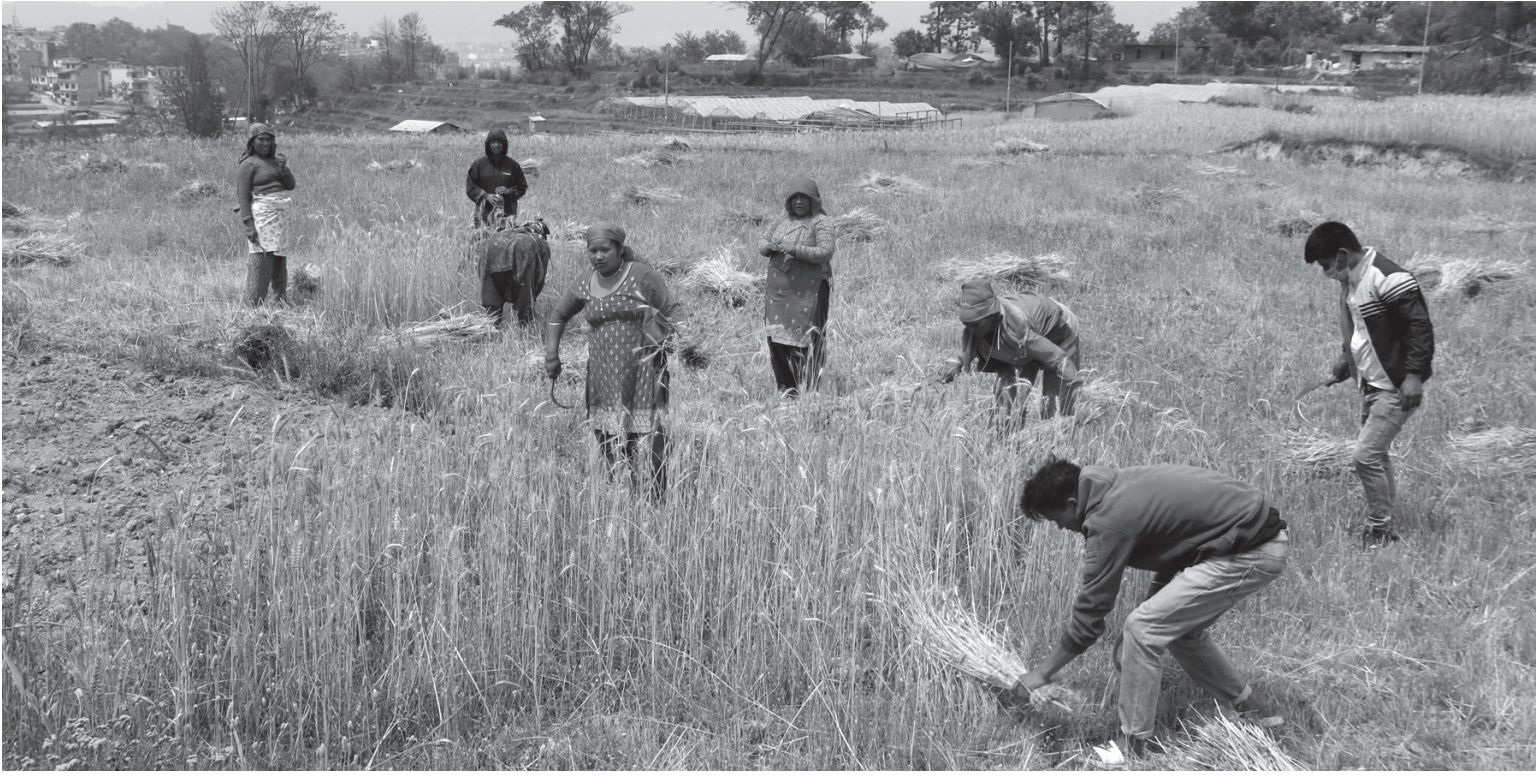
गहुँबाली काट्दै किसान टोखा नगरपालिका-२ टोखा चण्डेश्वरीमा स्थानीय किसान खेतमा गहुँबाली काट्दै।