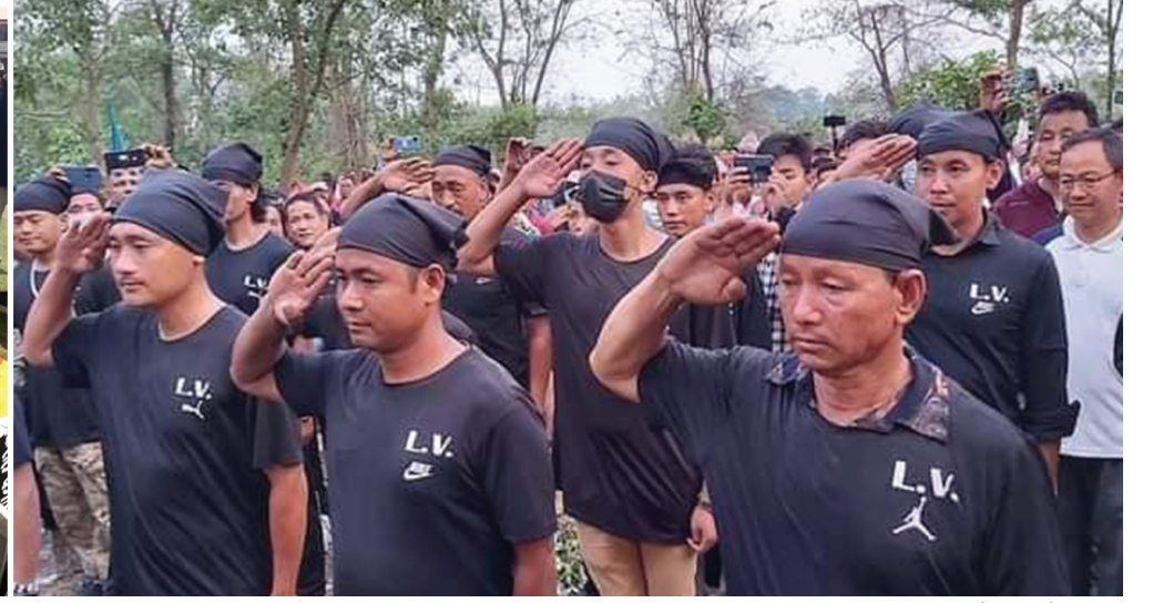
शान्ति: सामाजिक सञ्जाल