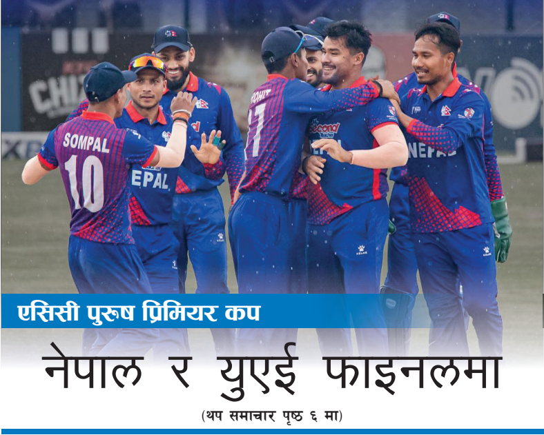
एसिसी पुरुष प्रिमियर कप नेपाल र युएई फाइनलमा (थप समाचार पृष्ठ ६ मा)

हुने बताउँछन्। उनले यस्ता दस्तामाथि नियन्त्रण गर्नु सरकारको दायित्व हुने बताए। तर, कोशीमा देखिएको आन्दोलनप्रति ठूला राजनीतिक दलहरू जिम्मेवार हुनुपर्ने उनलाई लाग्छ। यदि, आन्दोलनलाई खेलाँची ठानिए आन्दोलनरत पक्षले दस्तालाई मजबुत बनाउँदै जाने र त्यसलाई नियन्त्रण गर्न मुस्किल पर्न सक्छ। उनी थप भन्छन्, 'शीर्ष नेताहरू आन्दोलनलाई व्यवस्थापन गर्नुको सट्टा भड्काउन लागेको देखिन्छ। यो राम्रो होइन।' एमाले अध्यक्ष ओली एक सातादेखि कोशी प्रदेशका जिल्लाहरूको दौराहाता रहेका पहिचान पक्षधरहरू उनीविरुद्ध उत्रिएका छन्। उनलाई कालो फण्डा देखाउँदै प्रदर्शन गरिरहेका छन्। तर, ओलीले पहिचान पक्षधर आन्दोलनकारीहरूलाई आतंककारी र आन्दोलनलाई आतंकको संज्ञा दिएका छन्। आन्दोलनकारीहरूलाई भड्काउने खालका अभिव्यक्ति लगातार दिँदै आएका छन्। शान्तिबारे पाँचथरको फिदिम पुगेका ओलीले चुनौती दिँदै भने, 'दुई-चार जना केटा सडकमा उफ्रँदा (बाँकी पृष्ठ २ मा)