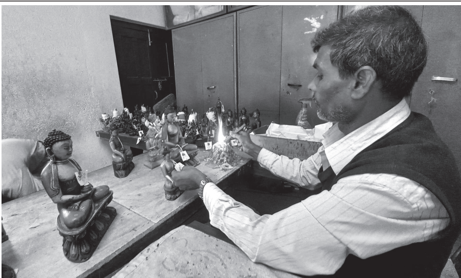
निर्यात गरिने मूर्ति पुरातत्व विभागका कर्मचारी विभिन्न मुलुकमा निर्यातका लागि तयार गरिएका भगवान गौतम बुद्ध, गणेश र मञ्जुश्रीका मूर्तिमा 'मुलुकवाहिर लैजाने स्वीकृति'को छाप लगाउँदै। मूर्ति निर्यातका लागि उक्त विभागको छाप अनिवार्य चाहिन्छ।