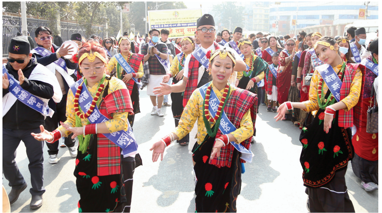
ल्लोसार आशिमला तम् ल्लोसारको अवसरमा शुक्रबार काठमाडौंमा आयोजित भाँकीमा गुरुङ महिलाहरू नृत्य प्रस्तुत गर्दै।

२०२२ मा २५ लाख पर्यटक धान्ने होटलको क्षमता रहेको छ। चिनियाँ पर्यटक आउने वातावरण बनेको खण्डमा विदेशी पर्यटक बढ्ने उनको विश्वास छ। सरकारी तथ्यांकमा मुलुकभर एक हजार १०० होटल छन्। हानको विवरणमा सबैखाले होटल गरी चार हजार छन्। ट्रेकिङ एजेन्सिज एसोसिएसन अफ नेपाल (टाना)का अध्यक्ष नीलहरि वास्तोला पनि नयाँ वर्ष पर्यटनमा आशा जगाउने वर्ष हुने भएकाले महामारीपछिको पर्यटनलाई पुनरुत्थानको गतिमा हाँसला प्रदान गर्न मद्दत पुग्ने विश्वास व्यक्त (बाँकी पृष्ठ २ मा)