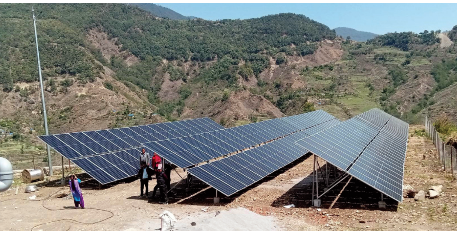
डोटीमा सोलार मिनिग्रेट जडान। डोटी जिल्लाको दक्षिण भेगमा रहेको बडिकेदार गाउँपालिका-५ मार्कोटमा सोलार मिनिग्रेट जडान। वैकल्पिक ऊर्जा प्रवर्द्धन केन्द्रको सात करोड १२ लाख र बडिकेदार गाउँपालिकाको ७९ लाखको लगतमा १०० किलोवाटको सौर्य मिनिग्रेट जडान गरिएको हो।