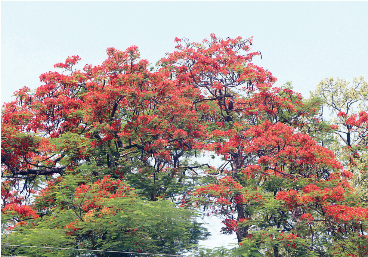
ढकमढक नेपाल प्रहरी शिक्षालय भरतपुर अगाडि ढकमढक फुलेको गुलमोहोर फूलका कारण आन्तरिक पर्यटकहरूले सेल्फी खिच्ने र टिकटक बनाउने क्रम बढ्दै गएको छ।